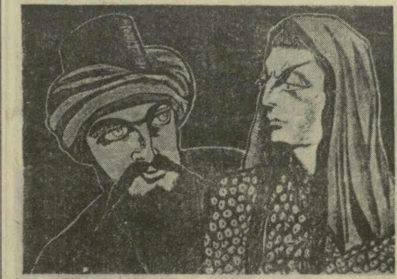
Иллюстрации к «Баши-Ачуги» художников Е. Ахвледиани (внизу) и М. Гвалая.

Более полувек великий поэт воспевал идею освобождения трудящихся от социального и национального гнета. Родина, поработанная и страдающая, была воплощена поэтом в образе отважного и дерзкого бунтаря Амирали (Прометей), прикованного к Кавказским горам. Грузия пела слова его стихов, исполненные светлой надеждой.