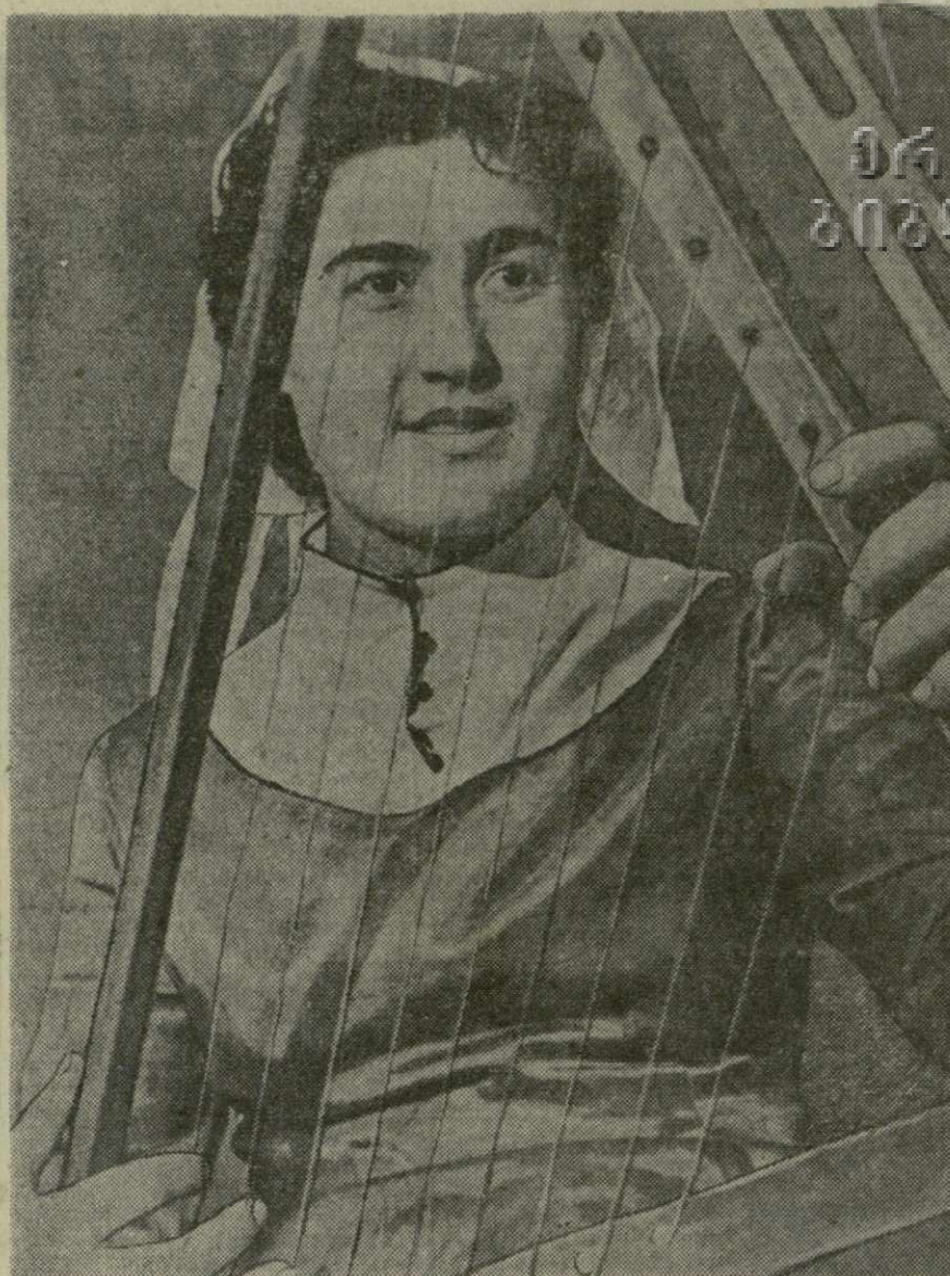
«Девушка играет на Чанги». Фотохуд Г. Вахтангадзе.

«40 ЛЕТ СОВЕТСКОЙ АРМЕНИИ» Открытие выставки состоится 29 ноября, в 5 час. вечера.