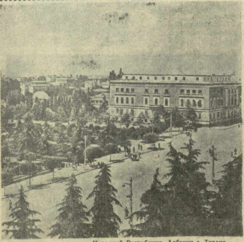
На снимке: столица Народной Республики Албании г. Тирана.

РАДИО ПРОГРАММА ПЕРЕДАЧ НА 30 НОЯБРЯ ПО ПЕРВОЙ ПРОГРАММЕ 08.30 — провозвешен Е. Ленина, С. Тушкова и С. Кави; 09.20 — литературная передача; 11.00 — материал из газет; 11.30 — трансляция на Москву; 12.15 — Д. Аракишвили. Телесюжеты: «Лепира»; 12.45 — албанские народные песни; 17.20 — Моцарт. Соната ля-мажор. Исполняет Г. Каптарадзе; 17.40 — передача для учащихся; 18.05 — грузинские народные песни; 18.45 — Бела Барток. Албанский портрет. Исполняет симфонический оркестр радио и телевидения Грузии. Дирижер — Лиле Кналадзе, солист — Серго Шанидзе; 19.15 — концерт по заказу радиослушателей; 19.45 — передача из цикла «Герои нашего времени». Очерк о заслуженном инженере Эбралидзе; 21.00 — радиожурнал для женщин; 21.30 — концерт из произведений С. Цинцадзе; 22.00 — литературная передача, посвященная 125-летию со дня рождения выдающегося американского писателя Марка Твена; 22.30 — Глазунов. «Шопениана». ПО ВТОРОЙ ПРОГРАММЕ 21.00 — Хачатурян. Сюита «Маскарад»; 21.30 — литературная передача; 21.40 — вокальные произведения грузинских композиторов; 22.05 — беседа на русском языке; 22.20 — Брамс. Скрипичный концерт.