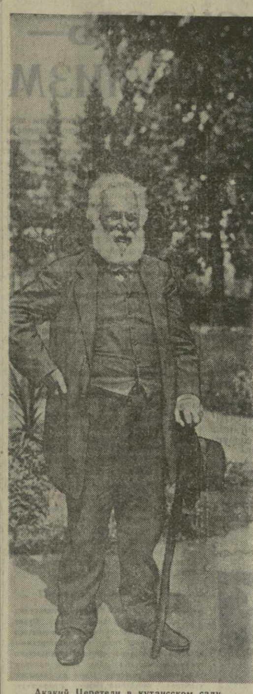
Акакий Церетели в кутаисском саду.

В этот период поэт впервые обращается к эпическим формам. В 1875 году он публикует историческую поэму «Баграт Великий», навеянную героической борьбой Грузии против Тамерлана.