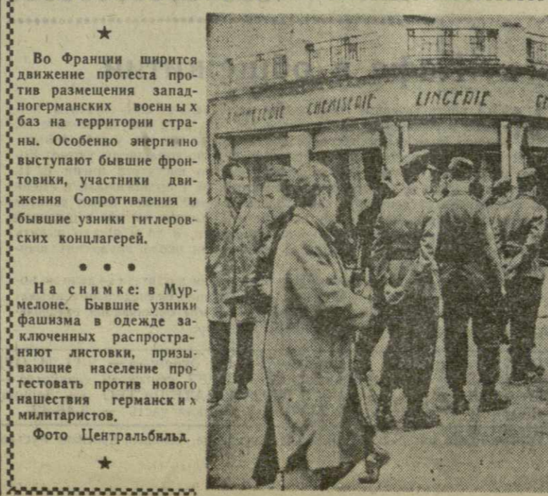
На снимке: в Мурелоне. Бывшие узники фашизма в одежде заключенных распространяют листовки, призывающие население протестовать против нового нашествия германских милитаристов.