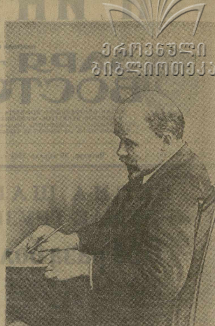
В. И. Ленин на конгрессе Коминтерна.