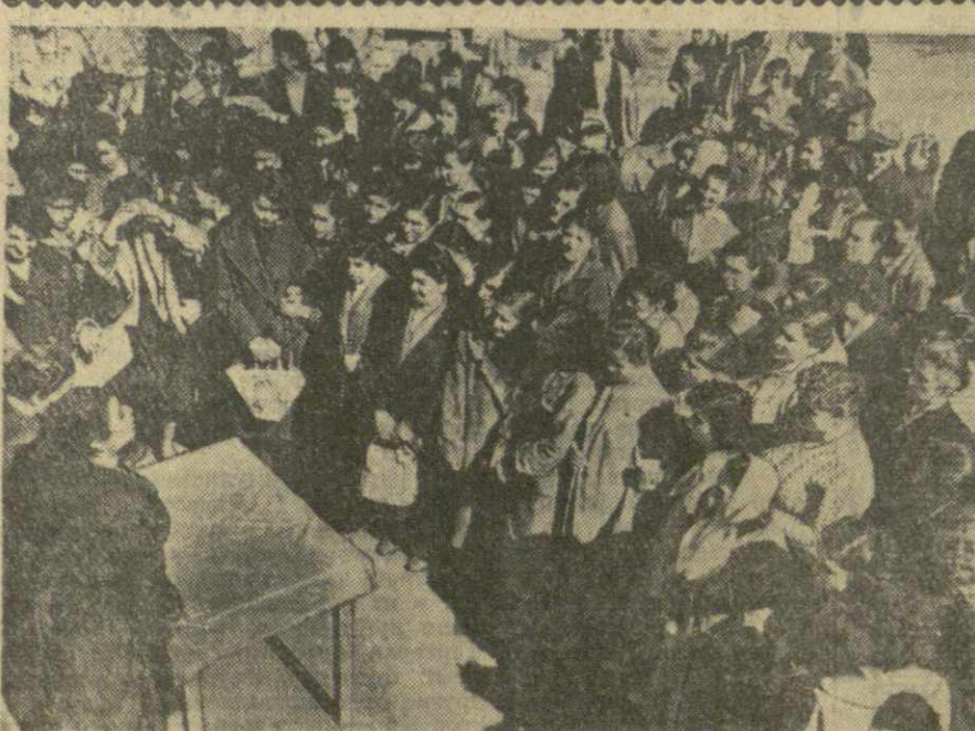
Митинг на Тбилисской фабрике «Грузтрикотаж».

Коллектив фабрики единодушно одобрил заявление Советского правительства и послание Н. С. Хрущева.