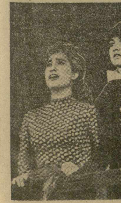
На снимке: сцена из спектакля.