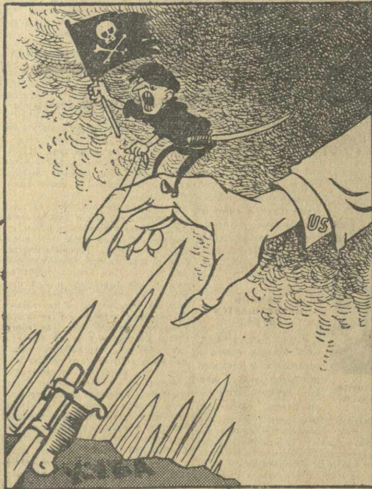
получат по заслугам. Рис. А. Канделаки.

НЬЮ-ИОРК, 19 апреля. (ТАСС). Премьер-министр Лаоса принц Суванна Фума поставил в известность государственного департамента США о том, что он отменяет свою поездку в Соединенные Штаты.