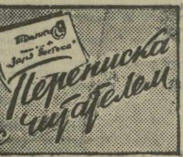
Переноска с шифалеми

Почему это происходит? Может быть, некому следить за растениями? Нет, вся беда заключается в том, что люди, которым поручено это дело, плохо или даже вовсе не занимаются