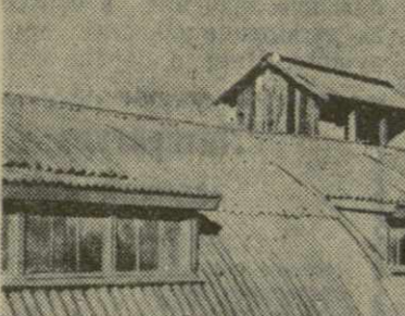
На снимке: готовый птичник из железобетона, покрытый гнутыми шиферными панелями.

крупных животноводческих ферм с поголовьем дойных коров от 400 до 1,000 и птицеводческих ферм — от 20 до 100 тысяч кур-несушек. Укрепление животноводческих хозяйств дало возможность уделить особое внимание механизации трудоемких процессов и индустриализации строительства. В этом отношении нынешний год является переломным в нашей республике. Можно смело сказать, что работники сельского хозяйства, механизаторы и сельские строители Грузии встречают декабрьский Пленум ЦК КПСС с хорошими показателями в деле удешевления и индустриализации сельского строительства.