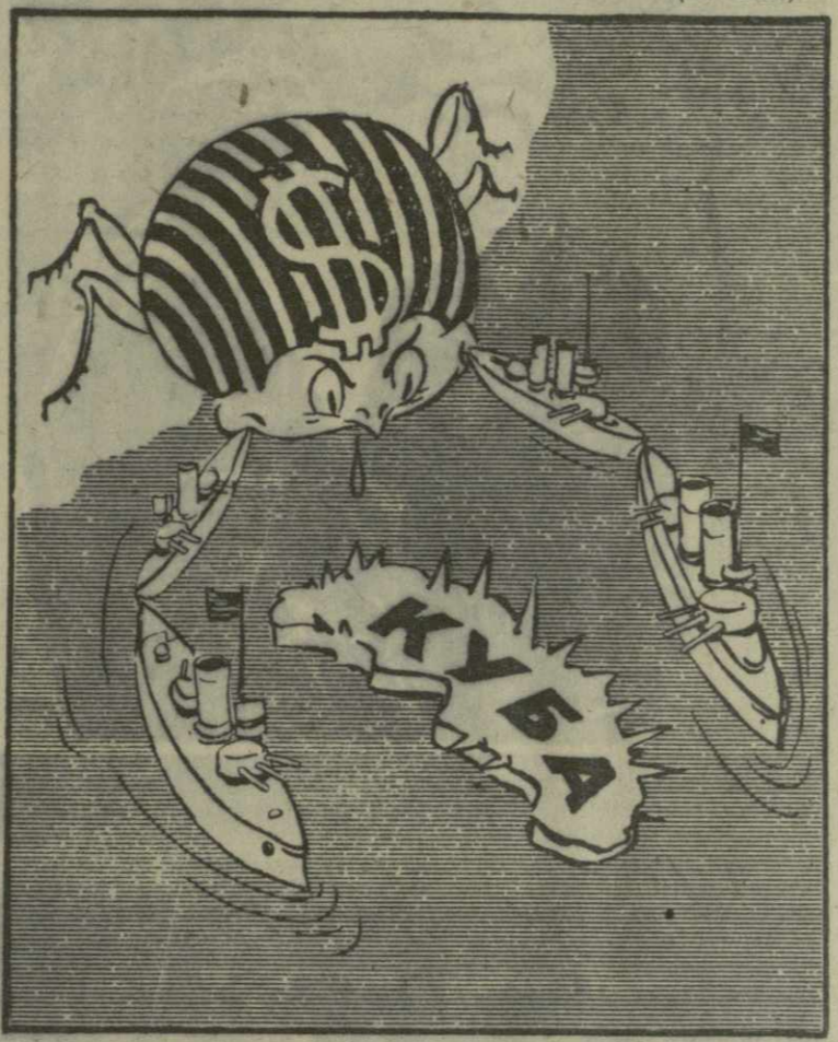
АМЕРИКАНСКИЙ КРАБ В КАРИБСКОМ МОРЕ. Рис. А. Кандекали.

Большое внимание Заявлению Советов представителей коммунистических и рабочих партий продолжают уделять газеты Софии, Варшавы, Бухареста, Улан-Батора, Пхеньяна, Ханоя, Гаваны, Каира, Токио и других столиц мира. (ТАСС).