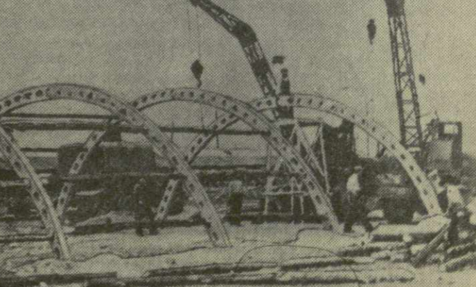
На снимке: монтаж арочного железобетонного птичника в Самгорском племенном птицеводстве.

Г. ЧИРАКАДЗЕ, директор проектного института «Грузгипросельхоз».