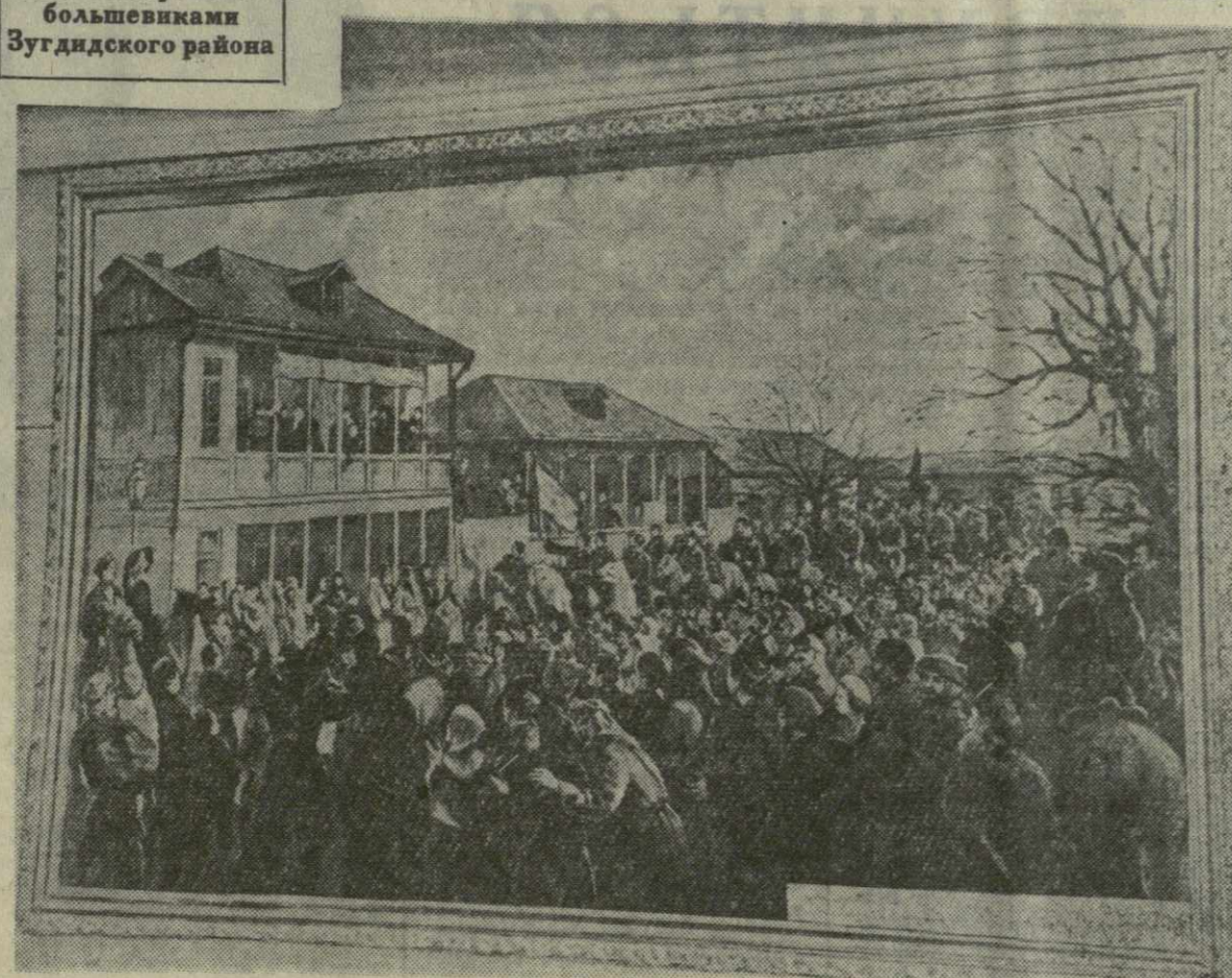
Митинг в Зугдиди, 1921 год.