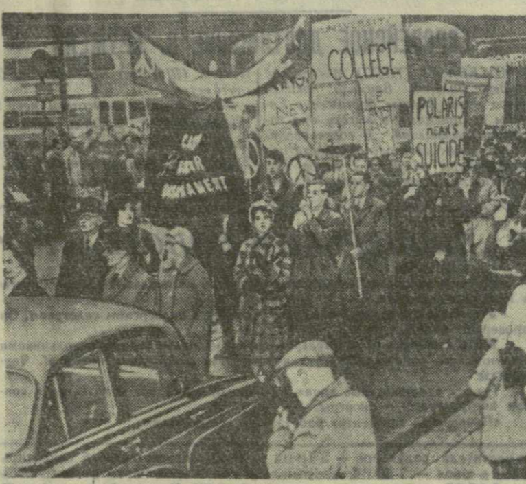
Англия. В Глазго состоялась демонстрация протеста против создания в Шотландии базы для американских подводных лодок, снабженных ракетами «Поларис». На снимке: во время демонстрации. Плакаты гласят: «Поларис» — это самоубийство».