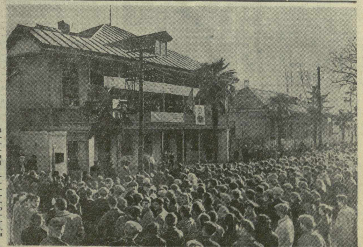
Митинг в Зугдиди, 1960 год.