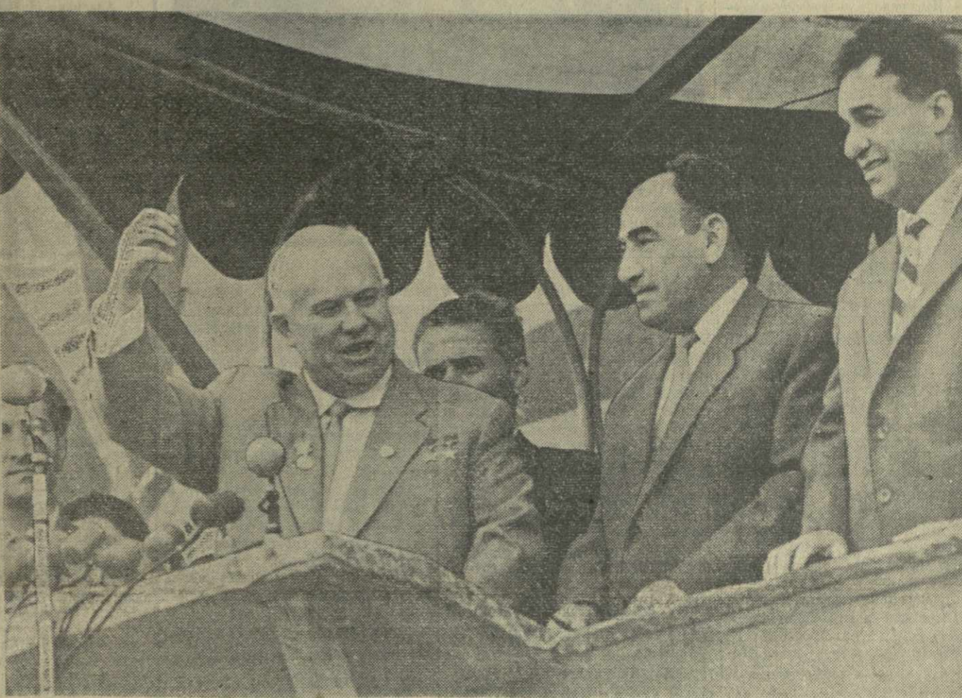
7 мая 1961 года. Ереванский Республиканский стадион. Митинг трудящихся, посвященный 40-летию установления Советской власти и образования Коммунистической партии Армении. Выступает Первый секретарь ЦК КПСС, Председатель Совета Министров СССР Н. С. ХРУЩЕВ.

Проходя по тенистым аллеям, товарищ Н. С. Хрущев с одобрением отзывается о благоприятных условиях работников предприятия, превративших заводскую территорию в прекрасный цветущий сад. Ему сообщает, что здесь много и