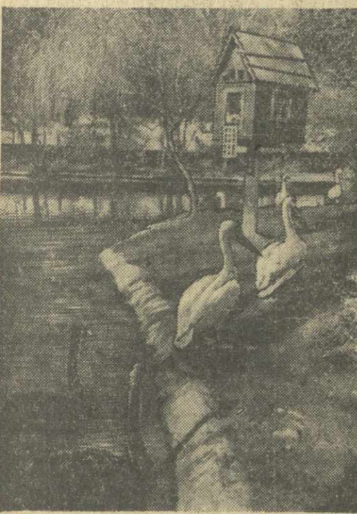
Один из уголков Гагрского приморского парка.

Главная новость дня ДЕЛИ, 20 мая. (ТАСС). Предстоящая встреча в Вене Председателя Совета Министров СССР Н. С. Хрущева и президента США Дж. Кеннеди вызывает огромный интерес в политических и журналистских кругах индийской столицы. Газеты полагают, что сообщение как главную новость дня, отнесшую на задний план все другие события международной и внутренней жизни. Политические комментаторы отмечают, что первый личный контакт между главой Советского правительства и американским президентом представляет огромную возможность для обмена мнениями по важнейшим международным вопросам, от успешного решения которых зависит судьба мира. Газета «Индия экспресс» в редакционной статье заявляет, что беседа Н. С. Хрущева с Дж. Кеннеди «превышает все ожидания, если они будут способствовать ослаблению международной напряженности». Политические комментаторы отмечают, что первый личный контакт между главой Советского правительства и американским президентом представляет огромную возможность для обмена мнениями по важнейшим международным вопросам, от успешного решения которых зависит судьба мира. Газета «Индия экспресс» в редакционной статье заявляет, что беседа Н. С. Хрущева с Дж. Кеннеди «превышает все ожидания, если они будут способствовать ослаблению международной напряженности».