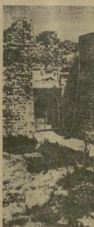
Это развалины Веницианского дворца. Вы видите башню Отелло. Предание говорит о том, что с этой башней Отелло любилась любовь. Здесь, в этом здании, гуляла Дездемона. Здесь все напоминает о трагической любви благородного мавра и белокурой венецианки.

ликой стране социализма. Наши машины останавливали на дорогах, и тут же возникали импровизированные митинги. С любовью и теплотой говорят простые люди Кипра о Советском Союзе. Власть пытаются помешать народу узнать правду о нашей стране, но с каждым днем им все труднее и труднее делать это. Во время пребывания в Пафосе местное руководство ПЕО попросило нас посетить деревню Пел, расположенную на склонах гор. Все трудовое население собралось на митинг. Во время беседы начальник местной полиции попытался запугать крестьян и сорвать встречу. Но никто не сдвинулся с места. В грозном молчании крестьяне были скрыты столько непоколебимой силы, что незадачливый начальник полиции счел за лучшее удалиться. На митинге, состоявшемся на одной из площадей Никозии, я рассказал киприотам о Грузии — стране древней и самобытной культуры, о грузинском народе, который, как и киприоты, в прошлом вел героическую борьбу за независимость и свободу против многочисленных врагов. Внимательно слушали все рассказ о сегодняшней Грузии, о ее успехах в экономическом и культурном развитии, достигнутых с помощью великого русского народа за 40 советских лет, о ее мощной индустрии и высокоразвитом многогранном сельском хозяйстве, о том, как из бывшей отсталой аграрной окраины царской России