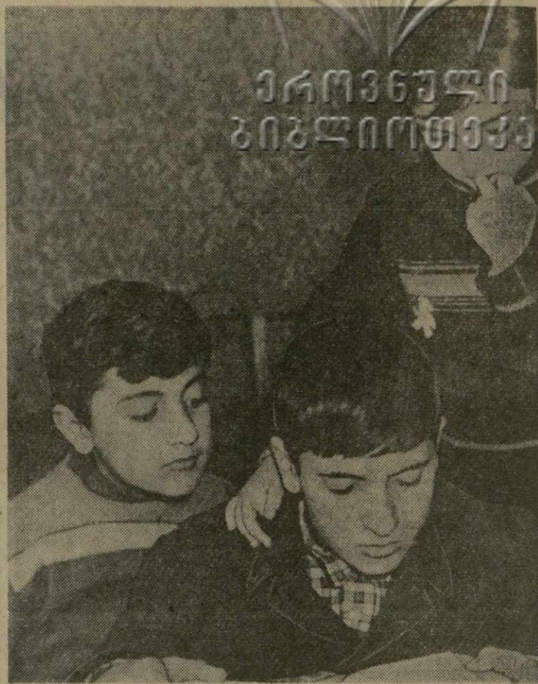
А ЧТО ЖЕ БУДЕТ ДАЛЬШЕ?..