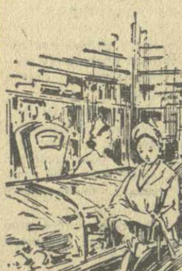
НОВЫЙ МАГАЗИН Рис. Г. Ронишвили.