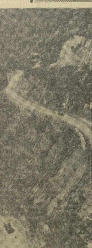
На снимке: на горных дорогах Грузии.