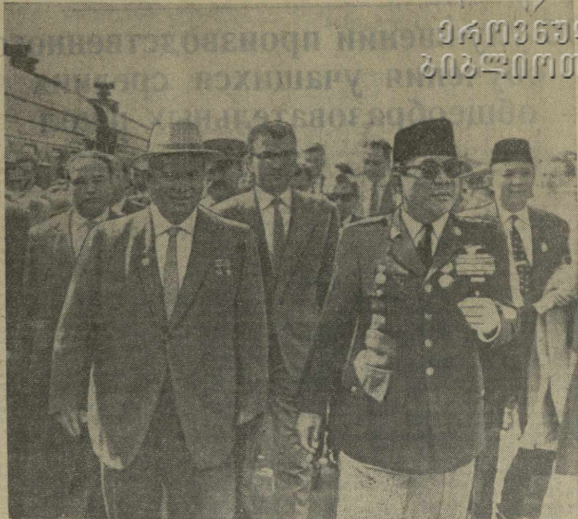
Ленинград, 7 июня 1961 года. Президент и премьер-министр Республики Индонезии доктор Сукарно и Председатель Совета Министров СССР Н. С. Хрущев на перроне Московского вокзала.

Дети вручают высоким гостям букеты цветов. Начальник почетного караула отдает рапорт президенту и