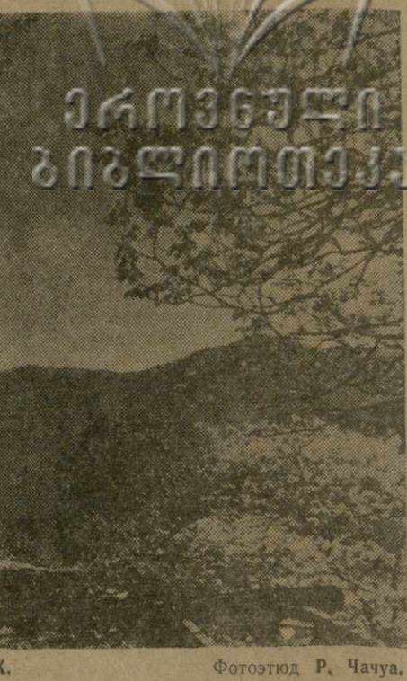
В ГОРАХ.