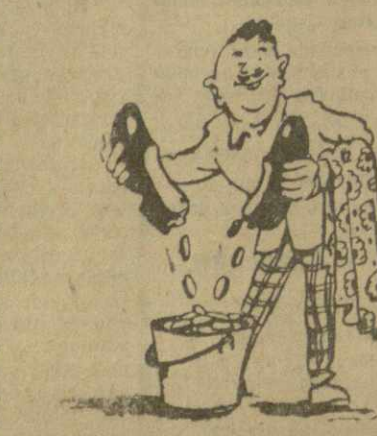
Фокусник из горийского универсамы.