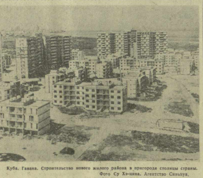
Куба. Гавана. Строительство нового жилого района в пригороде столицы страны.

ГАННОВЕР, 11 июня. (ТАСС). Сегодня здесь закончился слет называемого «Землячества силезских немцев». В течение трех дней в Ганновере провозглашались территориальные претензии западногерманских реваншистов. Эти претензии нашли официальную поддержку в выступлениях на слете представителей правительства ФРГ и политических партий. Председатель свободной демократической партии (СВДП) Менде прямо заявил, что Польша не имеет ни исторических, ни юридических прав на Силезию. Он выступил за ревизию границ с Польшей, заявив, что граница по линии Опер-Нейсе «не является обязательной, с точки зрения права». Вчера вечером «Землячество силезских немцев» устроило провокационную политику — правительства ФРГ в отношении Западного Берлина. Выступивший при свете факелов и под бой барабанов бургомистр Западного Берлина Брандт благодарил реваншистов за поддержку, которая, как он заявил, «сейчас как раз необходима». Слет реваншистов закончился сегодня выступлением Аденауэра на митинге переселенцев. От имени правительства ФРГ Аденауэр поддерживает притязания «Землячества силезских немцев» на часть государственной территории Польской Народной Республики. «Я уверен, — заявил канцлер ФРГ, — что настанет день выполнения ваших желаний». Аденауэр призвал собравшихся в Ганновере реваншистов воспитывать молодежь в духе надежды на осуществление их требований.