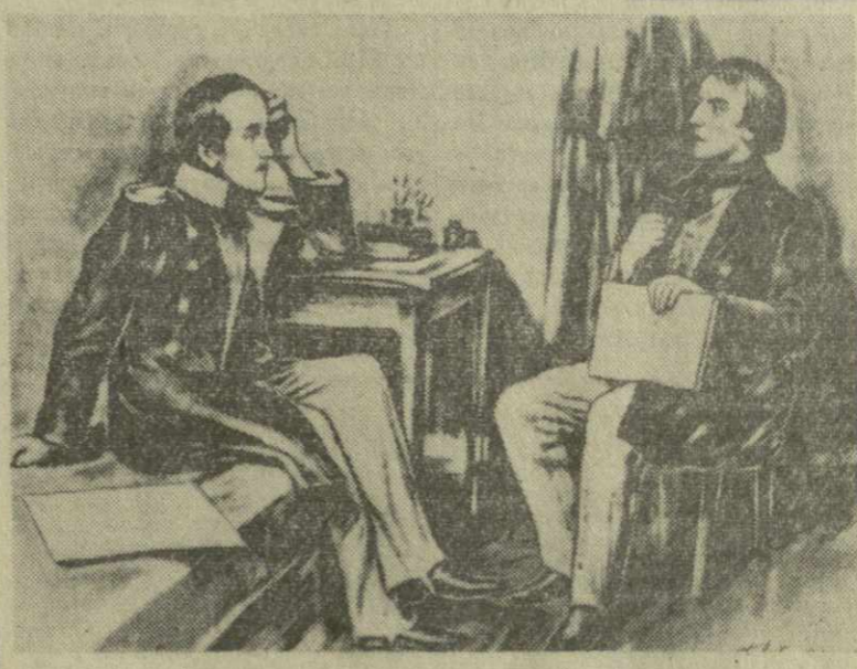
Белинский посещает Лермонтова на Кавказе. Фотопроизведение с картины Б. Лебедева.

«Завидую внукам и правнукам нашим, которые в 1940 году увидят Россию, стоящую во главе всего образованного мира, дающую законы науки и искусства и принимающую дань благоговейного уважения от всего прогрессивного человечества».