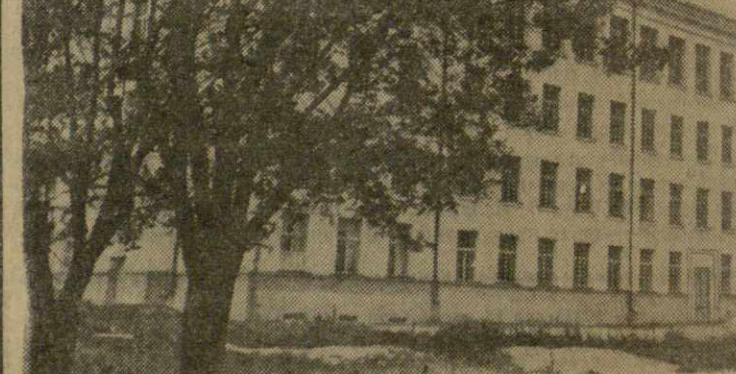
На снимке: новая средняя школа в Цители-Цкаро. Фото М. Квирикашвили.

В. ХОТЯНОВСКИЙ. (Спец. корр. «Зари Востока»).