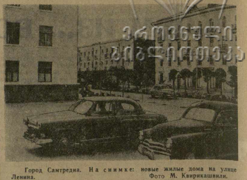
Город Самтредия. На снимке: новые жилые дома на улице Ленина.

Грузинская республиканская контора Стройбанка СССР доводит до сведения учреждений, организаций, предприятий, рабочих и служащих, получивших ссуды банка на строительство индивидуальных жилых домов и капитальный ремонт собственного жилого фонда, что, согласно данным обязательств, они обязаны были погасить ежеквартально задолженность до 15 числа первого месяца наступающего квартала; однако некоторые заемщики не внесли до 15 апреля платежи за II квартал текущего года и допустили просрочку, тем самым срывая выполнение кассового плана банка. Грузинская контора Стройбанка предупреждает индивидуальных заемщиков, учредителей, организации и предприятия, что они обязаны до 20 июня 1961 года внести задолженность, числящуюся за ними, в противном случае, против них будут приняты меры принудительного взыскания через судебные органы с вынесением судебных расходов и пени в двойном размере. Грузинская республиканская контора Стройбанка СССР.