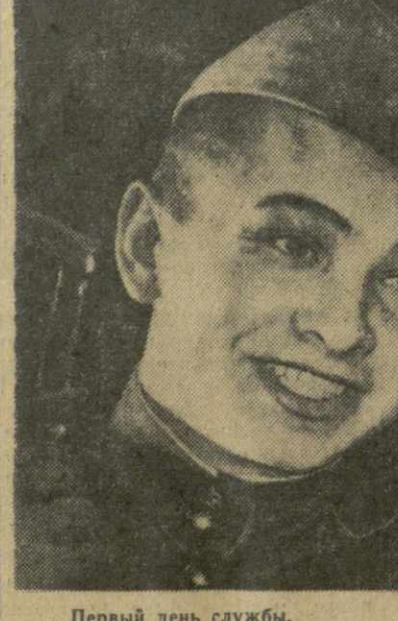
Первый день службы.