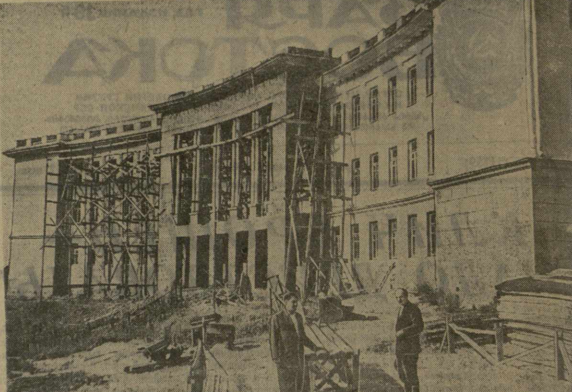
В селе Джумати Махарадзевского района строится школа-интернат. На снимке: строительство школы-интерната.