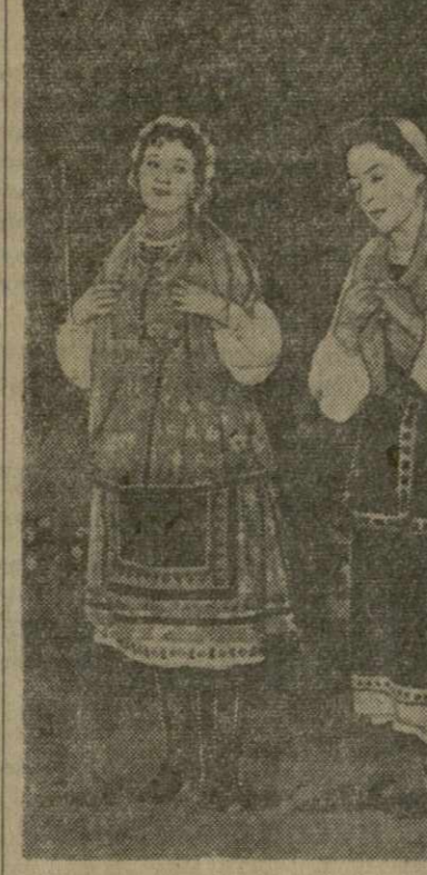
На снимке: сцена из спектакля «Не суждено».