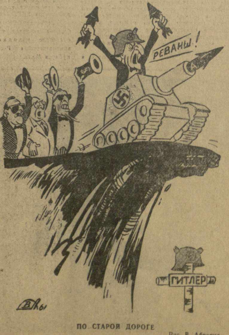
ПО СТАРОЙ ДОРОГЕ

12 июля в Москву из Улан-Батора возвратилась делегация КПСС во главе с членом Президиума ЦК КПСС, секретарем ЦК КПСС М. А. Суловым, принимавшая участие в работе XIV съезда МНРП.