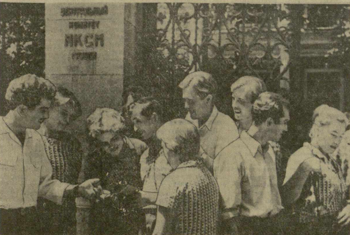
Эти жизнерадостные юноши и девушки едут на целину. Вот она, заветная комсомольская путевка. Сбылся мечта! Впереди — бескрайние просторы, впереди — большие дела.