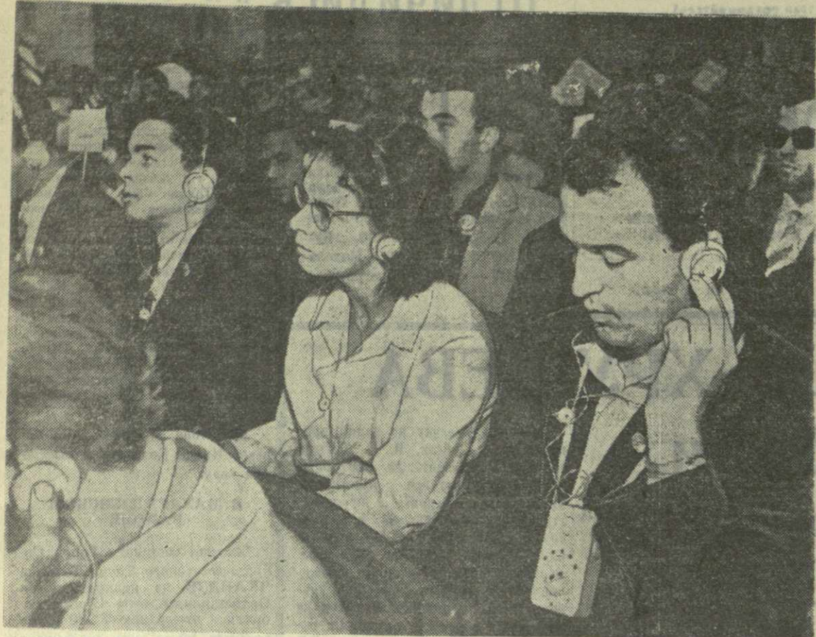
МОСКВА. В Колонном зале Дома союзов продолжает свою работу Всемирный форум молодежи. На снимке: делегаты от Западного Берлина в зале заседания.