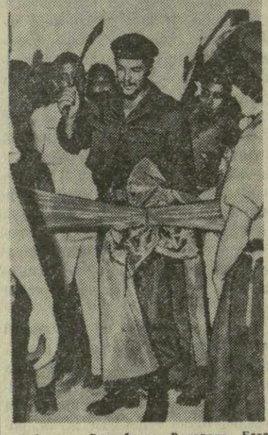
Кубинская Республика. В городе Батуми на юге провинции Гавана недавно открыта карандашная фабрика — первое из ста новых предприятий, предусматриваемых программой экономического развития на ближайшие пять лет. Фабрика была открыта министром промышленности майором Эрнесто Че Гевара. На снимке: министр промышленности майор Гевара перерубает ленту с помощью молота.