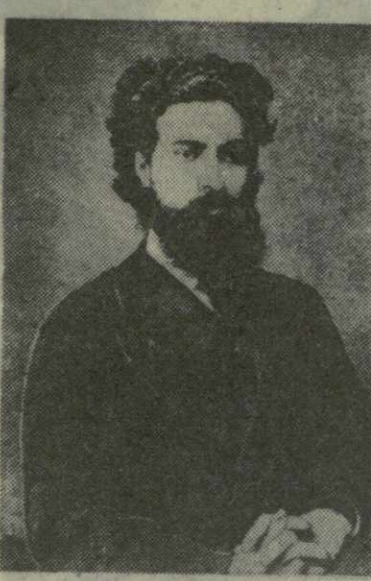
И. Р. Тархишвили.