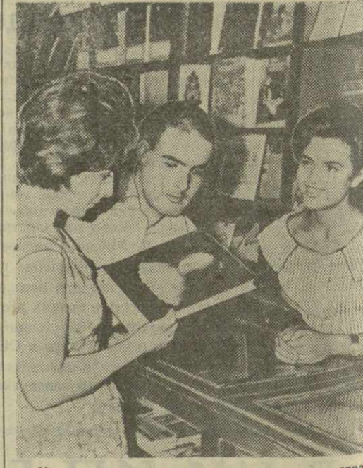
На снимке: в магазине литературы стран народной демократии.

Жители Тбилиси живо интересуются литературой, изданной в странах народной демократии. В магазине литературы стран народной демократии по улице Ленина всегда оживленно. Здесь можно встретить людей самых разных профессий — рабочих, научных работников, актеров, студентов. Большим спросом пользуется румынская литература. Многие интересуются образцами румынской прозы и поэзии, некоторые покупатели спрашивают альбомы с видами городов и достопримечательностей братской социалистической страны. Из имеющихся изданий на румынском языке особым успехом пользуются красочно иллюстрированные детские сказки и избранные произведения М. Садовяну.