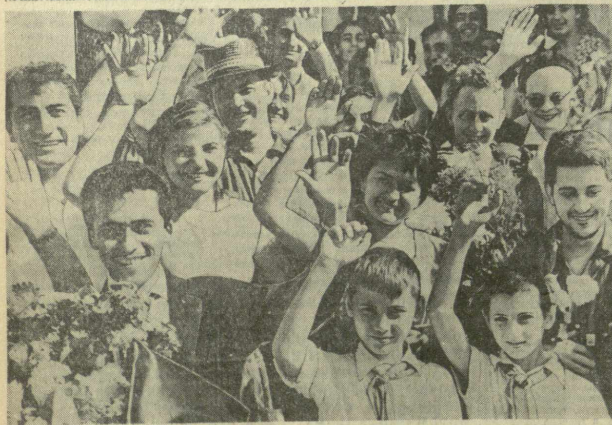
Вчера в Тбилиси прибыли участники Всемирного форума молодежи — представители молодежи Бразилии, Финляндии и Португалии. В Тбилисском аэропорту состоялся митинг. На снимке: встреча участников Всемирного форума молодежи в Тбилисском аэропорту.

ХАНОИ, 4 августа. (ТАСС). Около 40 тыс. лаосцев в прошлом месяце приняли участие в митингах и демонстрациях, требуя немедленного вывода войск США и их марionеток с территории Лаоса, сообщило радио «Голос Лаоса».