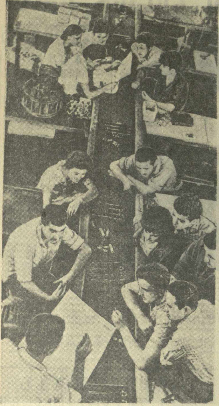
Рабочие цеха № 9 Тбилисского станкостроительного завода имени С. М. Кирова знакомятся с проектом Устава Коммунистической партии Советского Союза.

Новый программный документ нашей партии придает нам новые силы, рождает горячее стремление поднять советскую науку на высоту, имя которой — Коммунизм.