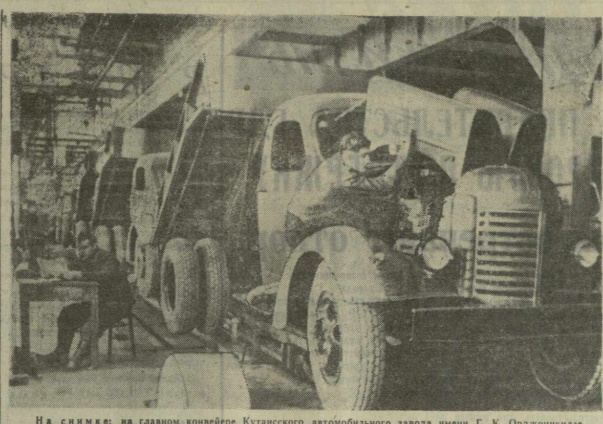
На снимке: на главном конвейере Кутаисского автомобильного завода имени Г. К. Орджоникидзе.