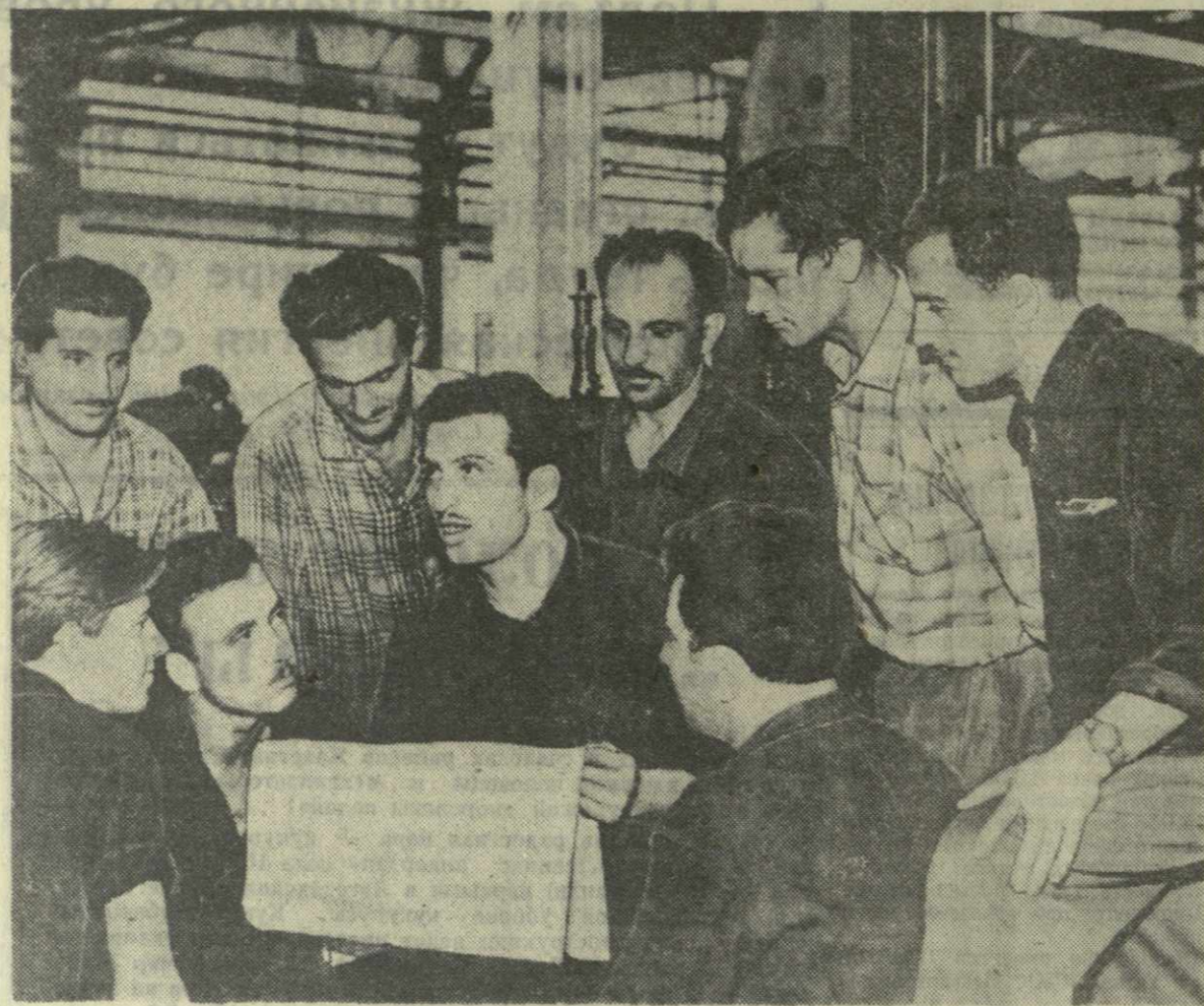
Рабочие инструментально-штамповочного цеха Кутаисского автомобильного завода имени Г. К. Орджоникидзе обсуждают проект Программы КПСС.