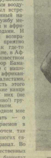
— Купите манго, — обратилась к нам малийка.