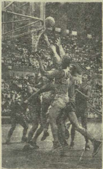
На снимке: острый момент у щита рижан.

посильный для него темп. Накал игры достигает предела. Счет растет в пользу динамовцев. Броски Минашвили издалека, смелые рейды к щиту Инцирвели, самоотверженная игра Лежава под щитом помогают тбилисцам одержать важную победу. Счет матча 69:54 в пользу хозяев поля. Наибольшее количество очков принес тбилисцам Хазарадзе — 20. У рижан самым результативным был Круминьш — 13 очков. Г. ГИГАШВИЛИ.