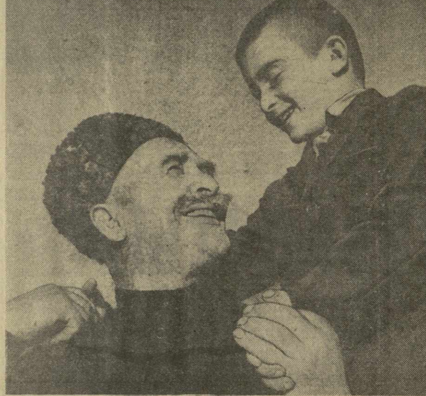
В хорошее время мы живем, внучек!

Открыто новое месторождение нефти польскими геологами на территории так наз. Польской низменности, в Зеленогурском воеводстве. Во время глубокого бурения одной из скважин была обнаружена нефть в количестве, которое позволяет надеяться на промышленное значение месторождений.