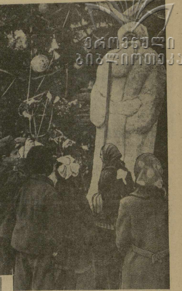
Много детворы в эти дни у новогодней елки на проспекте имени Руставели г. Тбилиси.

В кинотеатрах: имени Руставели, «Октябрь», «Коллизия» — «Жизнь холостяка»; «Амирания», «Исания», «Спартак», «Сакართველო» (Красный зал), «Газангули» — «Битва в пути» (2-я серия); «Тбилиси», «Сакართვეло» (Зеленый зал) — «Длинный день»; «Комсомолец», в Доме офицеров, в парке имени Кирова — «Анда»; имени 28 комиссаров (первый зал), «Казбеги» (2-й зал) — «Смех в раю»; имени 26 комиссаров (второй зал), «Колхозник», в клубе: имени Плеканова, имени И. Чавчавадзе — «Заергасе», 8; «Казбеги» (первый зал), в Доме культуры имени Горького, в саду Коммунаров — спорная программа кинофильмов;