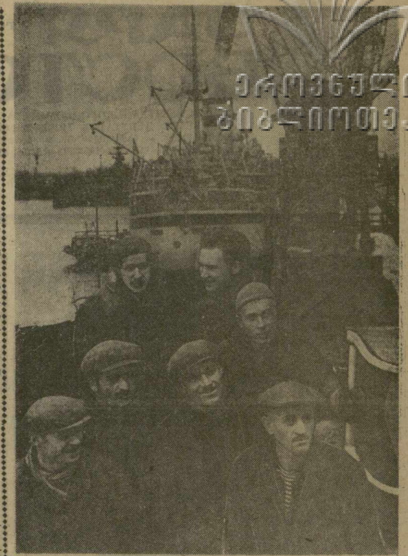
Успешно закончила 1961 год коллектив первого производственного района Потихушья порта. Здесь уже переработано более 70.000 тонн народнохозяйственных грузов в счет нового, 1962 года.

Крик услышали находившиеся вблизи колхозники села Усхаело Цагерского района Р. Гвазде и электромонтер В. Горгаглидзе. Не раздумывая, они в одежде бросились в воду и спасли утопающего — 14-летнего Юрия Гугава.