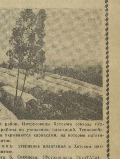
Хобский район. Цитрусосады Кетского совхоза «Ураг» ведут работы по утеплению плантаций. Теплолюбивые деревья укрываются каркасами, на которые натягивается полиэтилен. На снимке: утепление плантаций в Хетском цитрусосовом совхозе.