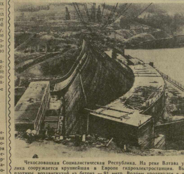
Чехословацкая Социалистическая Республика. На реке Ватава у Орляки сооружается крупнейшая в Европе гидроэлектростанция. Высота плотины, возведенной из бетона, — 91 метр. Водоем протянулся в длину на 71 километр. На снимке: строительство плотины у Орляки.