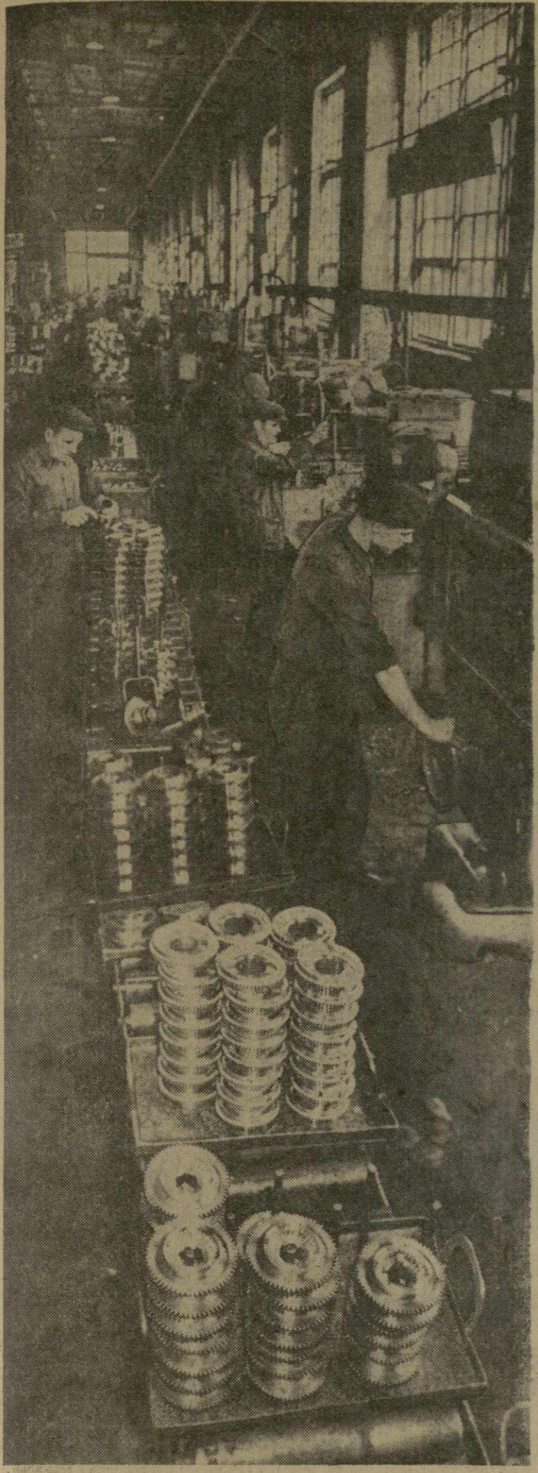
Поточные линии прочно обосновались в цехах Тбилисского станкостроительного завода имени Кирова. Они во много раз увеличивают выпуск продукции.