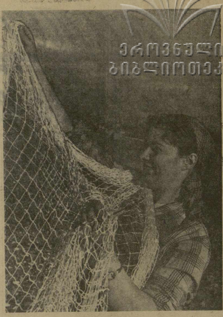
СУХУМСКАЯ судоремонтно-техническая станция обеспечивает капронными сетями все рыбохозяйственные колхозы Грузии и многие хозяйства за пределами республики.

Возникнет вопрос — а где же контроль? На этот вопрос дает ответ еще одна запись в блокаде.