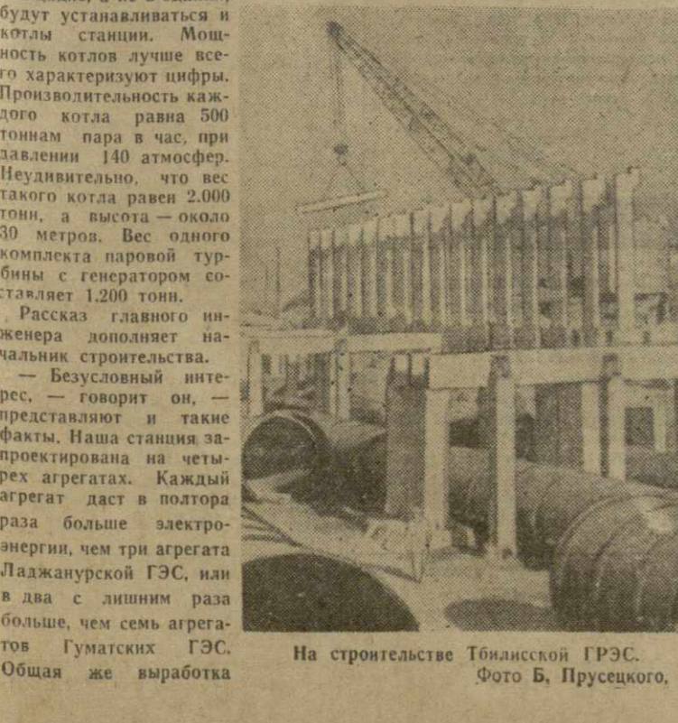
На строительстве Тбилисской ГРЭС.

НЬЮ-ЙОРК, 10 января. (ТАСС). Корреспондент агентства ЮПИ передает из Сеула: Генерал-лейтенант Чан Дь Ен, бывший начальник штаба армии и председатель военной хунты Южной Кореи, совершивший в прошлом году военный переворот и отстраненный затем от власти генералом Пак Чжон Хи, сегодня был приговорен к смертной казни за то, что он «емшал» военным кругам установить свою власть.