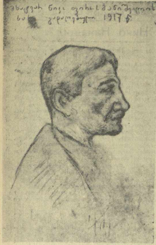
Нико ПИРОСМАНИШВИЛИ. Рисунок карандашом художника А. Мревлишвили.

Перед нами неопубликованное изображение Нино Пироманишвили из наследия известного грузинского художника Александра Мревлишвили (1866—1933).