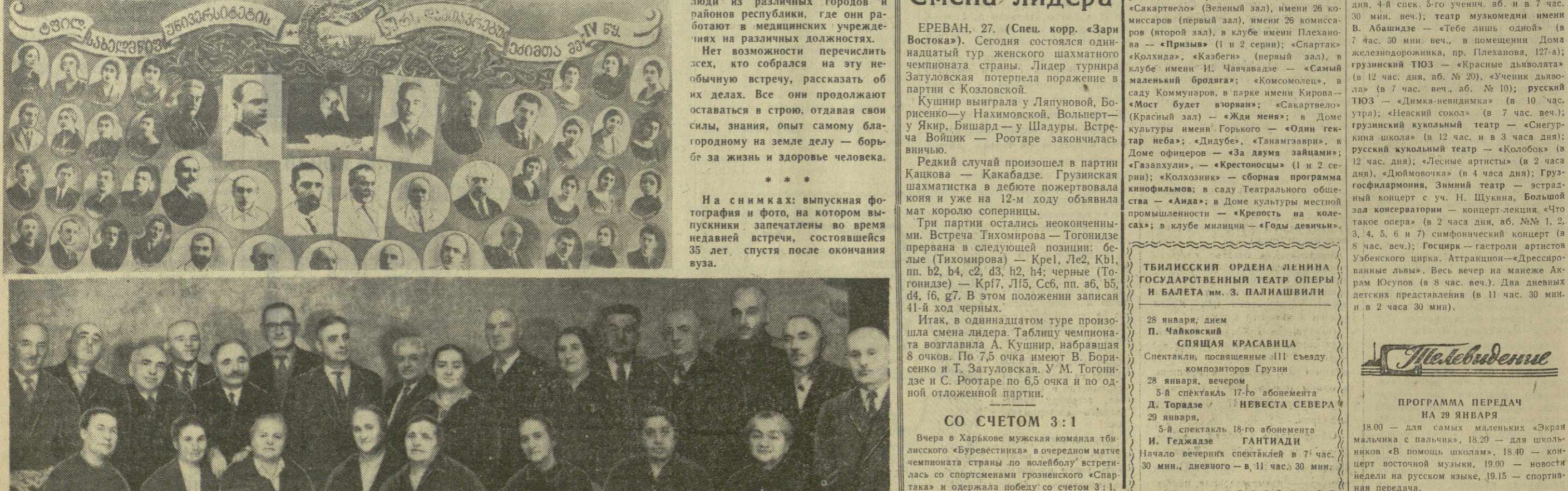
На снимках: выпускная фотография и фото, на котором выпускники запечатлены во время недавней встречи, состоявшейся 35 лет спустя после окончания вуза.

Взгляните, читатель, на эти фотографии. На одной из них — выпускники четвертого выпуска медицинского факультета Тбилисского государственного университета.