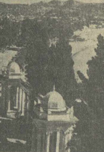
Фото С. Короткова.