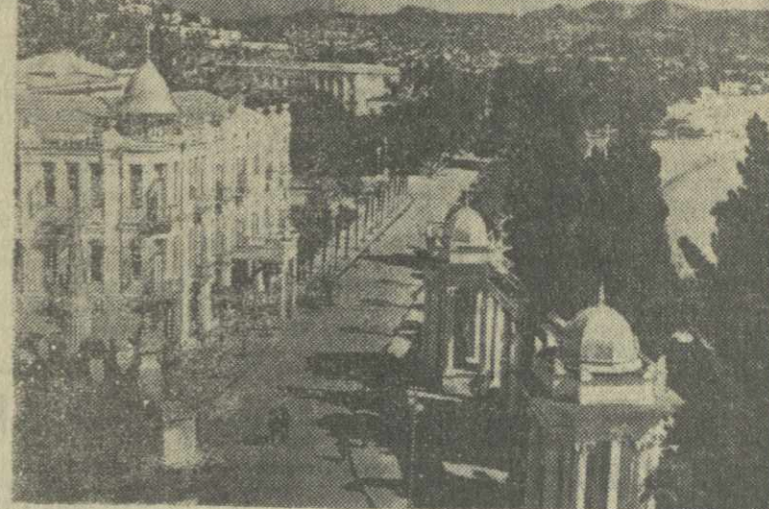
Сухуми сегодня. Проспект Руставели.

И пусть осуществляются ее прекрасные желания!