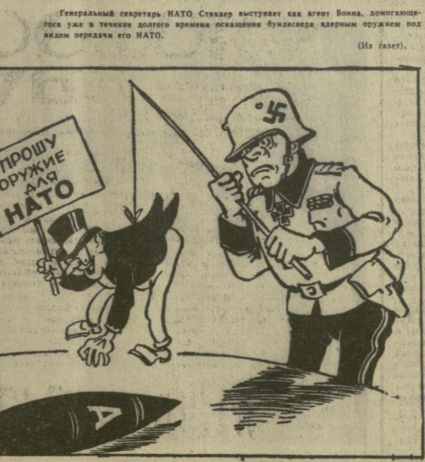
ЛОВЛЯ «РЫБКИ» НА ЖИВЦА. Рис. А. Кавдалака.

Совещание открывается 7 февраля, в 11 часов, в зале заседаний Верховного Совета Грузинской ССР. Регистрация участников совещания производится в помещении Грузинского филиала Института марксизма-ленинизма при ЦК КПСС (проспект Руставели, № 29) с 9 часов до 10 часов утра.