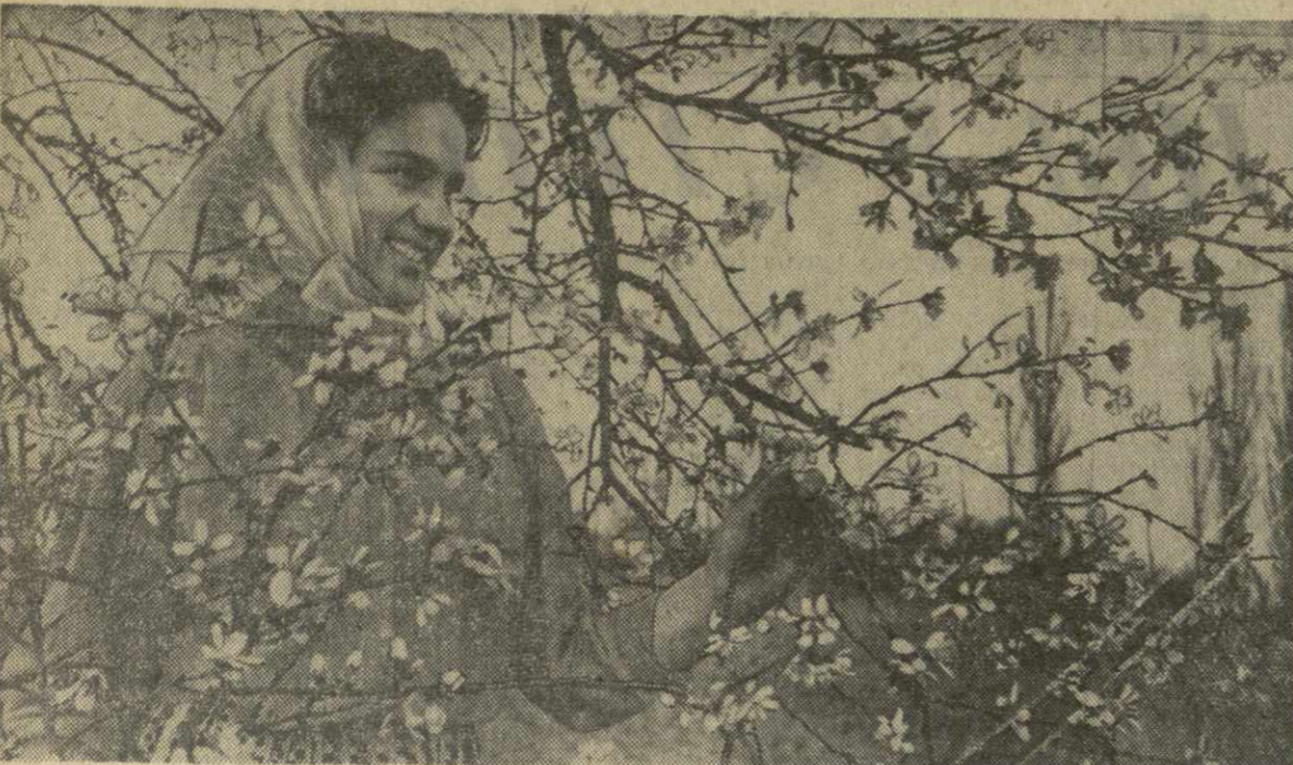
Середина зимы. В окрестностях Тбилиси деревья оделись в белый наряд. Это никого не удивило, если бы они были в снегу. На листьях календаря февраль, а уже цветет миндаля. Белый цветок разнится не только благоухающим ароматом, но и приближает весну.

ПРОГРАММА ПЕРЕДАЧ на 9 ФЕВРАЛЯ 18.00 — передача для школьников — «Мой любимый писатель» (к 150-летию со дня рождения Ч. Диккенса), 18.40 — кинофильм, 19.00 — передача «Чтоб сказка стала истиной», 19.20 — короткометражные фильмы, 20.00 — передача из цикла «Рационализаторы есть везде», 20.15 — концерт танцевальной музыки, 20.45 — «Вести», 21.00 — художественный фильм «Любимое старое пианино».