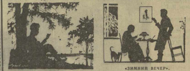
«А. С. ПУШКИН». «ЗИМНИЙ ВЕЧЕР». Рис. И. Ильяна.

3.500 агитаторов в Батуми используют все формы политического влияния на массы, активно участвуют в подготовке к выборам.