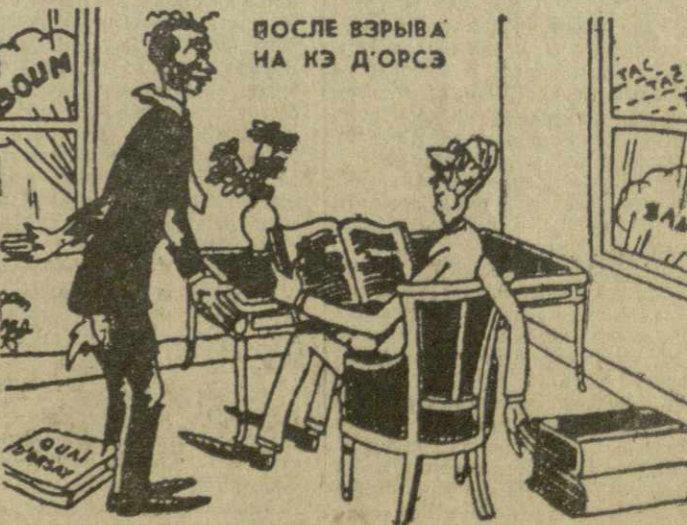
Кув де Мюрвил: Может быть, следует что-нибудь предпринять? Де Голль: Да! Надо звукозаписать мой кабинет. Рис. Жана Эффеля из еженедельника «Экспресс».

Распоясавшиеся фашисты из организации «ОАС» совершают террористические акты во Франции и Алжире. Один из взрывов недавно произведен в Париже в здании министерства иностранных дел на Ко Д'орсе.