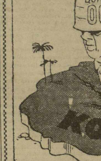
«Операция ООН» в Конго. Рис. А. Кандекали.

Посылку войск ООН в Восточную провинцию и провинцию Киву, которые являются оплотом патристических сил Конго, нельзя расценивать иначе, как новую уступку катангским сепаратистам и стремление затянуть раскол Конго.