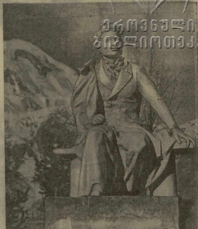
Военно-Грузинская дорога! По ней проходили А. С. Пушкин, М. Ю. Лермонтов... Замечательные стихи, сложенные в честь первооткрывателя Кавказа, Дарьяльского ущелья, Терек, этих чудесных уголков Грузии, вошли в золотой фонд мировой литературы. В эти дни в районном центре Казеги, у начала Дарьяльского ущелья, на фоне знаменитого Казбека установлен памятник великому русскому поэту Александру Сергеевичу Пушкину. На снимке: памятник А. С. Пушкину в Дарьяльском ущелье.

В обоих случаях мы не располагали конкретными фактами; мы исходили только из предположений. Подобные предположения, не подтвержденные, однако, конкретными фактами, безусловно, допустимы. Исследователь вправе привлечь к ним внимание читателя, но объявлять эти предположения за факт, как это нередко наблюдается в литературоведческой практике, с моей точки зрения, недопустимо. Они требуют проверки. Надо полагать, что дальнейшее разяснение, открытие новых документальных данных, безусловно, подтвердят самые смелые наши предположения.