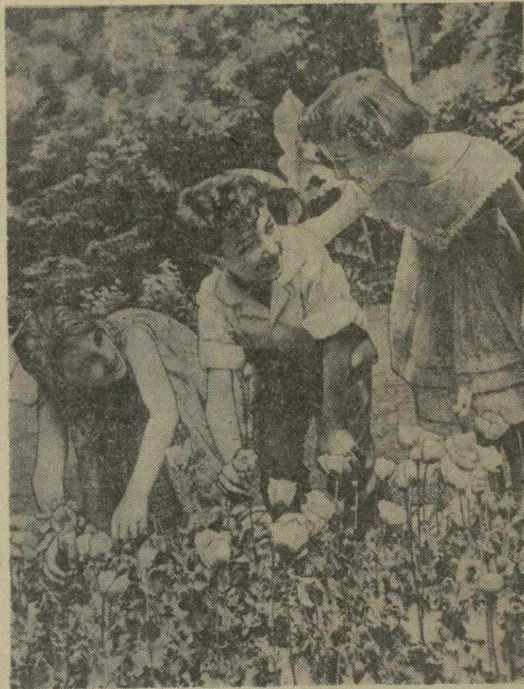
НЕОМРАЧЕННОЕ ДЕТСТВО

Ф. КЕШЕЛАВА, доцент, ученический секретарь отделения биологических наук АН Грузинской ССР.