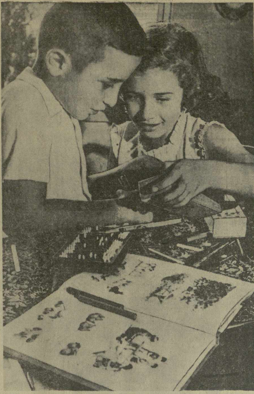
Мы уже школьники.

Районам и горкомам КП Грузии, исполкомам районных и городских Советов предложено принять меры для улучшения жилищно-бытовых условий учителей и обеспечить им предоставляемые властями льготы и преимущества. (ГрузТАГ).