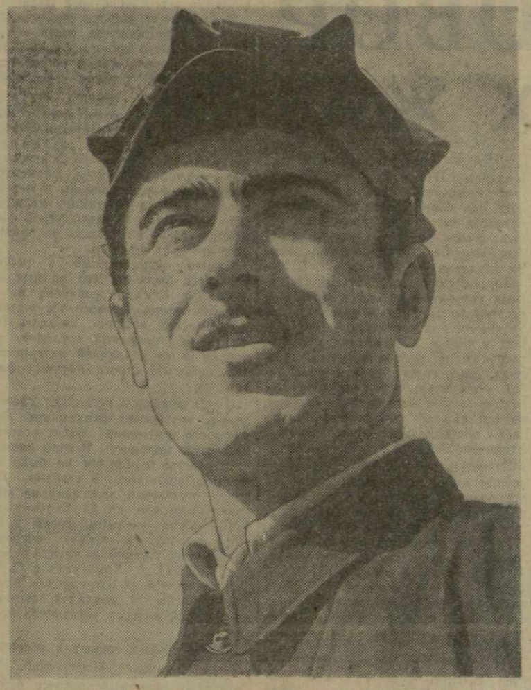
Цхалтубо. Коллектив гумбриновых разработок несет трудовую вахту в честь XVII съезда КПСС. Дать Родине тысячи тонн сверхплановой продукции — вот под каким девизом идет работа на всех производственных участках.