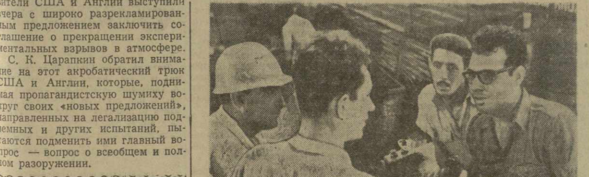
Республика Куба. Национализированное металлургическое предприятие имени Хосе Марти выпускает металл для народного хозяйства страны.

ЛОНДОН, 4 сентября. (ТАСС). В Англии создана организация с участием представителей всех партий, которая будет вести борьбу против плана включения Англии в европейский «общий рынок».