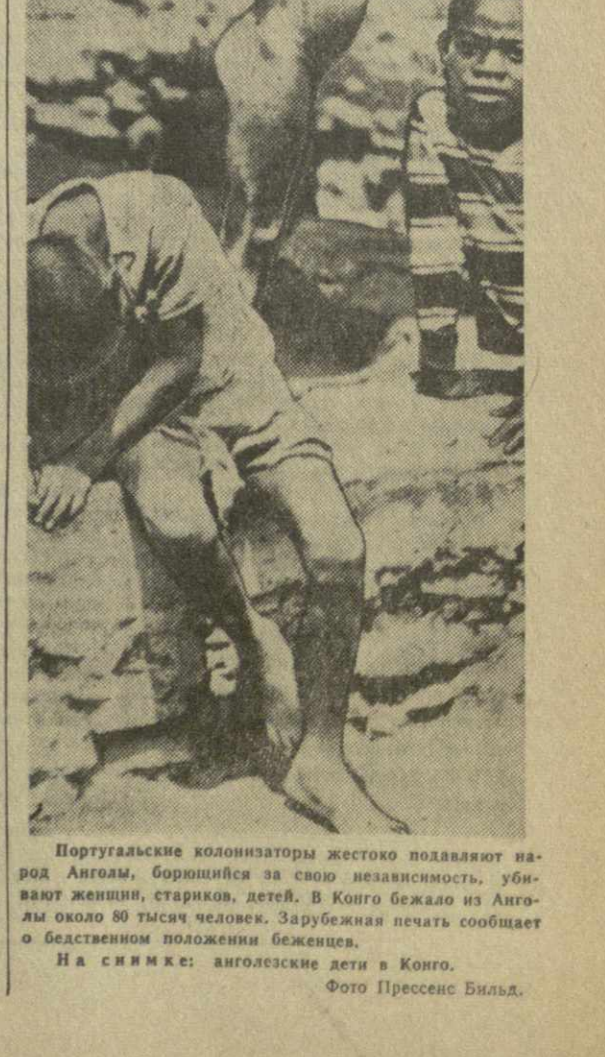
Португальские колонизаторы жестоко подавляют народ Анголы, борющийся за свою независимость. Убивают женщин, стариков, детей. В Конго бежало из Анголы около 80 тысяч человек. Зарубежная печать сообщает о бедственном положении беженцев. На снимке: ангольские дети в Конго.

США делают все, чтобы «подложить конец» ядерным испытаниям. Но это утверждение противоречит общеизвестным фактам. Проводя политику, направленную на обострение международной напряженности, не кто иной, как западные державы, и в первую очередь Соединенные Штаты, всецело срывали достижение соглашения о полном запрещении испытаний и применения ядерного оружия.