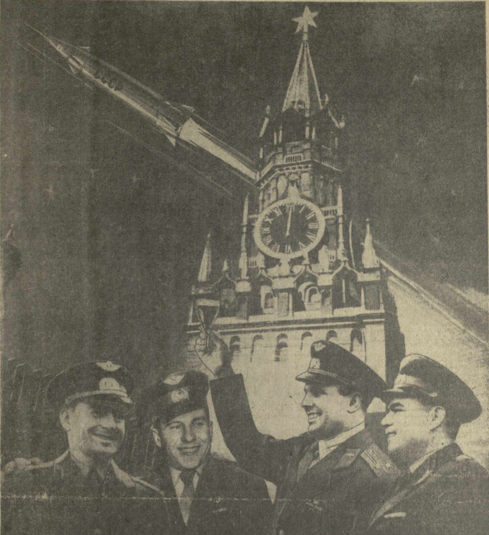
С НОВЫМ ГОДОМ! Фотомонтаж М. Квирикашвили.

Н. ХРУЩЕВ Первый секретарь Центрального Комитета Коммунистической партии Советского Союза, Председатель Совета Министров СССР. Л. БРЕЖНЕВ Председатель Президиума Верховного Совета СССР. Москва, Кремль. 31 декабря 1962 года.