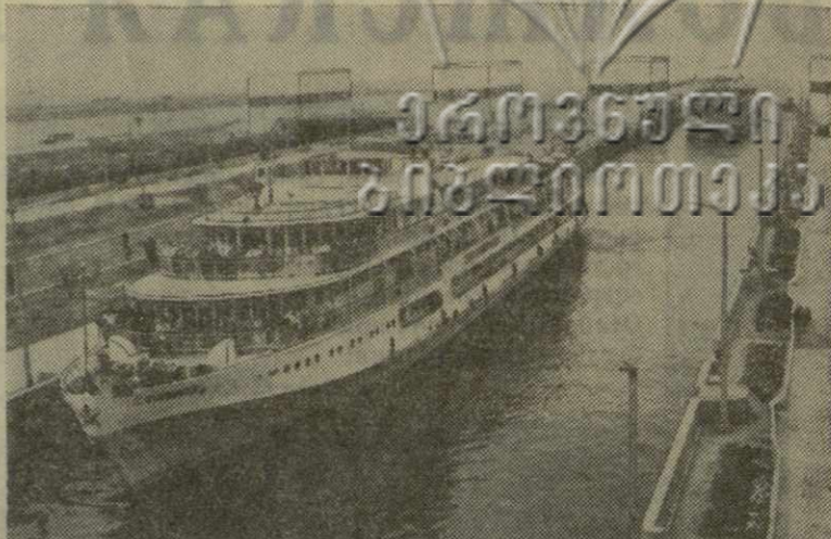
Сталинград. На год раньше срока завершено строительство Сталинградской ГЭС.

При въезде в город на Ленинском проспекте и других магистральных улицах тысячи и тысячи москвичей сердечно приветствовали посланцев героической Кубы. (ТАСС).