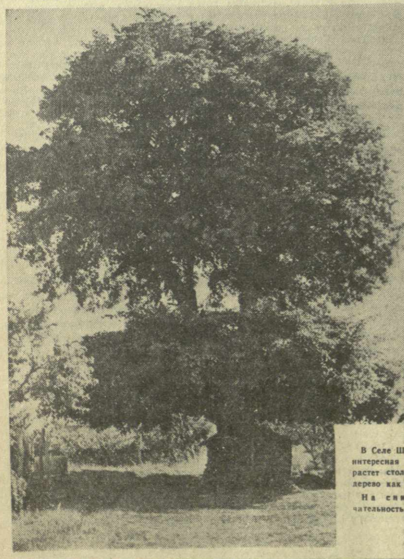
В селе Шидла Кварельского района есть интересная достопримечательность. Здесь растет столетний дуб в два яруса: одно дерево как бы вырастает из другого. На снимке: шидльская достопримечательность.