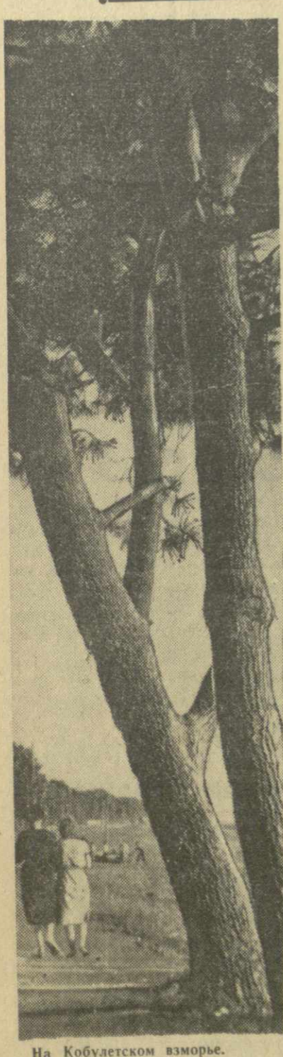
На Кобулетском взморье.