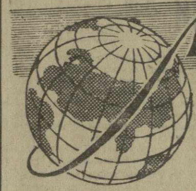
Берлинский вопрос может быть разрешен

С тех пор прошло полтора месяца. За это время редакция получила из различных организаций сообщения о мерах, принятых в отношении спекулянтов и нечестных работников советской торговли, из магазинов, расположенных на территории рынков.