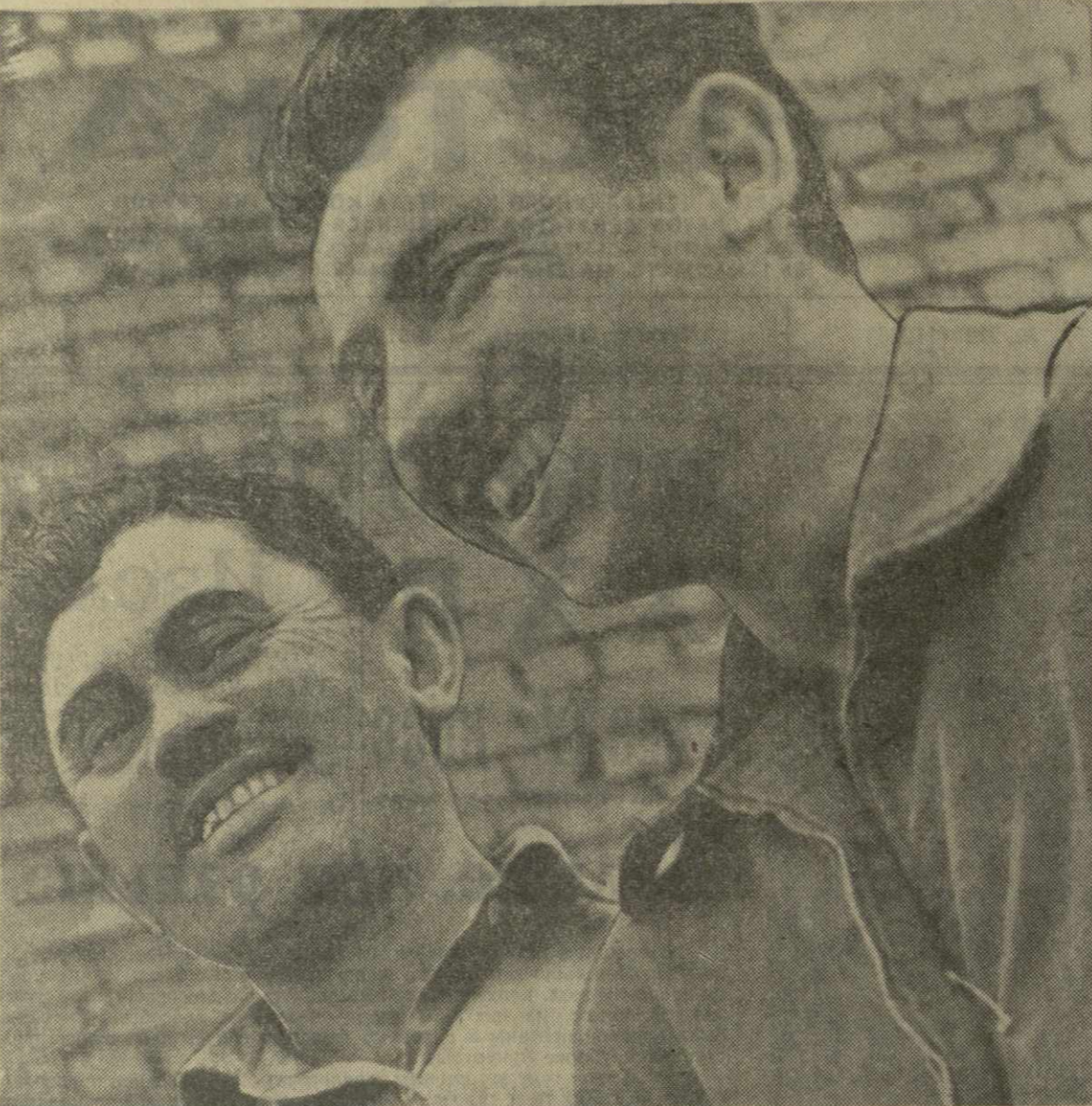
Большой трудовой подъем парит в эти дни на строительных площадках столицы нашей республики — Тбилиси. Несет трудовую вахту в честь XXII съезда партии, строители наращивают темпы работ и рапортуют о новых достижениях.