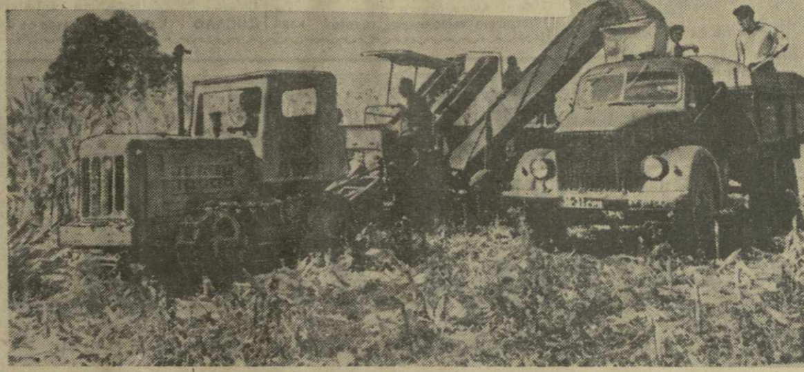
Наступил долгожданный день — уборка кукурузы. Колхозники артели им. Калинина села Чумлаки Гурджаанского района довольны выращенной ими «корольев полей». Здесь с каждого гектара посевов получают по 60 центнеров зерна, а с высокоурожайных — по 100 центнеров. Эти результаты превышают и план и обязательства кукурузоводов.