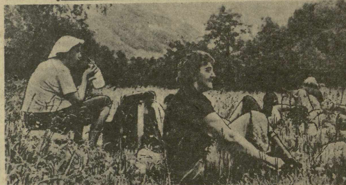
На снимке: чехословацкие туристы во время привала на Русской поляне Тебердинского заповедника.

В Галвестоне и многих городах Луизианы свирепствуют сильные вихри-торнадо, или водяные смерчи. Погибло, по меньшей мере, пять человек, пострадало большое