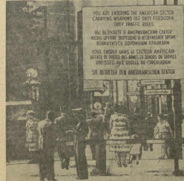
В столице Германской Демократической Республики Берлином имеются контрольно-пропускные пункты. Переход граждан осуществляется по предъявлении документов и разрешения органов народной полиции. На снимке: один из пунктов перехода в Западный Берлин.

«Казбег» (первый зал), «Ганамгвар», в Доме офицеров, в саду Театрального общества — «Алле паруса»; в парке культуры и отдыха имени Орджоникидзе — «Первое испытание»; в Доме культуры местной промышленности — «Сильные мира сего»; «Спартак» — «Борьба в долине»; «Амриани» (в змн. театре) — «Разноязычная Америка»; «Дидубе» (в змн. театре), в клубе имени Дзержинского — «Письмо телезвонкам»; в парке имени Кирова — «Визит инспектора»; «Колхозник» — «Собор Парижской Богоматери» (1 и 2 серии); «Дидубе» (в змн. театре) — «Морак сходит на берег»; имени 26 комиссаров (первый зал), в садах: Филармонии, Коммунаров — «Чистое небо»; «Исания» (в змн. театре) — «Любовные свидания»; «Комсомолец» — «На дальних берегах»; имени 26 комиссаров (второй зал) — «Солнцедар Солнечной долины»; имени 26 комиссаров (в змн. театре) — «Колхозник»; в парке Ваке — «Старик и море».