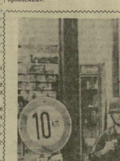
На снимке: американские солдаты в Западном Берлине.

Правительство Германской Демократической Республики осуществляло справедливые защитные мероприятия на секторальных границах столицы в целях пресечения подрывной деятельности, проводимой против республики рванштинскими элементами из Западного Берлина. На эти законные меры западные страны ответили провокационным введением в Западный Берлин дополнительных контингентов американских, английских и французских оккупационных войск.