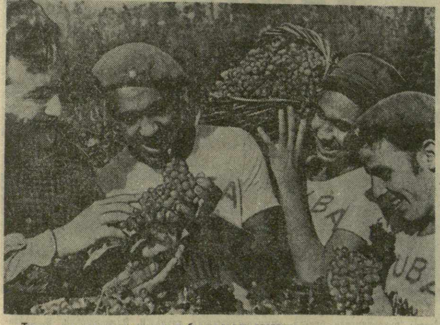
Тугие спелые кисти винограда кубинцы видят впервые.