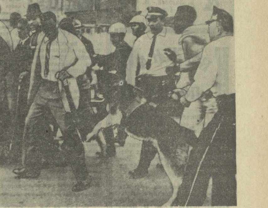
«Все люди равны перед богом», — вещают мордасты в капиталистических странах. Но в каждой есть исключения. Во Франции — представители народов Северной Африки, в Соединенных Штатах — выходцы из стран Латинской Америки и, конечно, негры.

Подробно описывая ход операции ООН, Линнер все вину за кровопролитие возлагает на «министра внутренних дел» Катанги Муноngo. В то же время он в острой форме старается выгородить главному виновника столкновений в Элизабетвиле — духовного главу конголезских сепаратистов бельгийскую марionетку Чомбе. Линнер пытается доказать, что «г-н Чомбе» якобы даже «издал приказ о прекращении огня», но этот приказ был игнорирован наемниками в катангской армии. Тем не менее Линнер фактически признает, что катангская марionеточная клика систематически игнорировала резолюцию Совета Безопасности от 21 февраля 1961 года об эвакуации из Конго всего бельгийского и другого иностранного военного и полуде