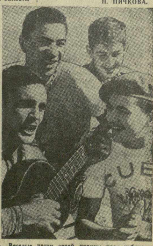
Веселые песни своей родины поет кубинская молодежь.

ришам. Я чувствую так, что мы не в гостях, мы дома. Нам дают крепкие знания. Выучимся, уедем на родину с вашим бесценным даром — знаниями. А там много работы. И он снял очки, чтобы все видели его радостные глаза. Н. ПИЧКОВА.