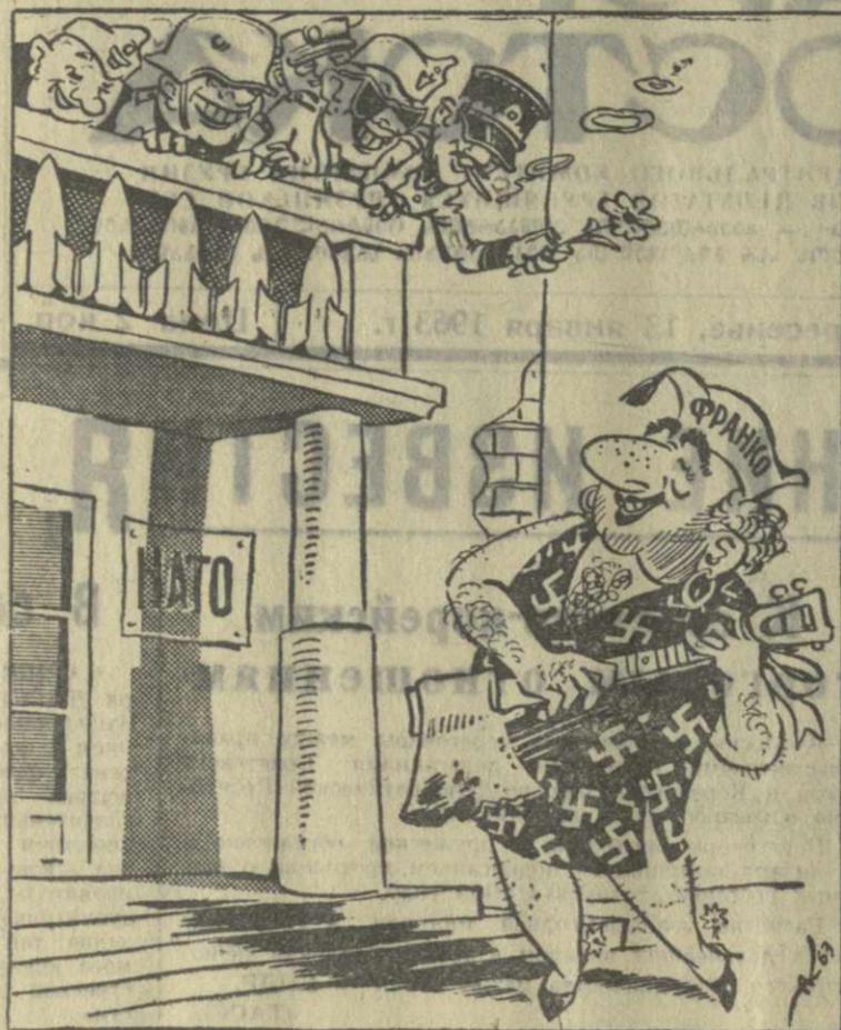
ИСПАНСКАЯ СЕРЕНАДА. Рис. А. Кандеаки.

Испанский диктатор Франко летит в НАТО, пиночичо заявляет, что его фашистский режим как можно лучше подходит для роли защитника интересов «свободного мира».