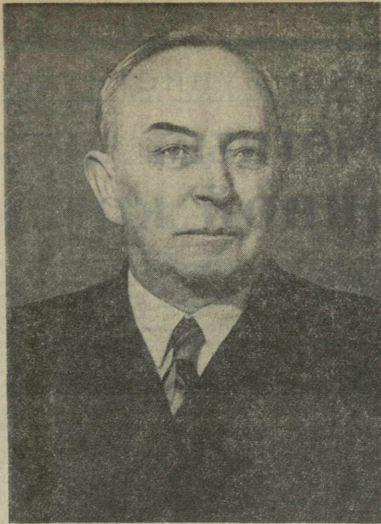
О. В. КУУСИНЕН.

Окруженная горячей любовью и доверием народа Коммунистическая партия Советского Союза и ее боевой отряд — Компартия Грузии! Уверенно идут навстречу своему XXI съезду, который народ уже образно назвал съездом строителей коммунизма.