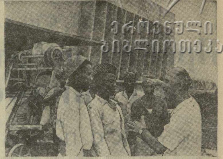
Гвинейский народ успешно трудится над выполнением своего первого трехлетнего плана развития страны. Этим планом предусматривается, в частности, создание мощной радиостанции, строительство которой ведется недалеко от столицы Гвинеи Конакри. Уже построено здание станции, ведется монтаж оборудования, прибывающего из Советского Союза, прокладывается кабель, который свяжет станцию с Конакри.

В сообщении командования отмечается, что полученные сегодня из