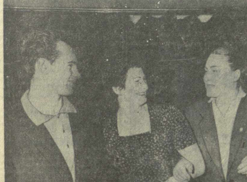
На снимке: вот они, выдающиеся советские легкоатлеты. Слева направо: рекордсмен мира В. Брумель, экс-рекордсменка мира Н. Думбадзе, олимпийский чемпион Р. Шавлакадзе.

В Харькове матч между командами «Авангард» — ЦСКА закончился ничью — 0:0.