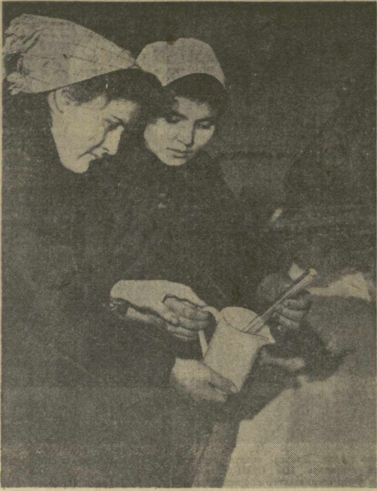
Во все республики Закавказья, на Северный Кавказ, на поля Ставропольщины непрерывным потоком идут минеральные удобрения — аммиачная и натриевая селитра, перманганат калия — с маркой Руставского азотного завода.

С кубинской стороны — Фаустино Перес, президент национального института водных ресурсов Республики Куба.