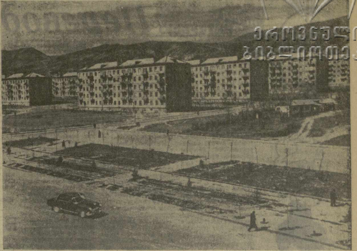
Тбилиси. На снимке: один из новых кварталов жилого массива в Сабуртало.

На избирательных участках члены агитационно-физкультурной бригады помогли агитаторам в выпуске стенных газет.