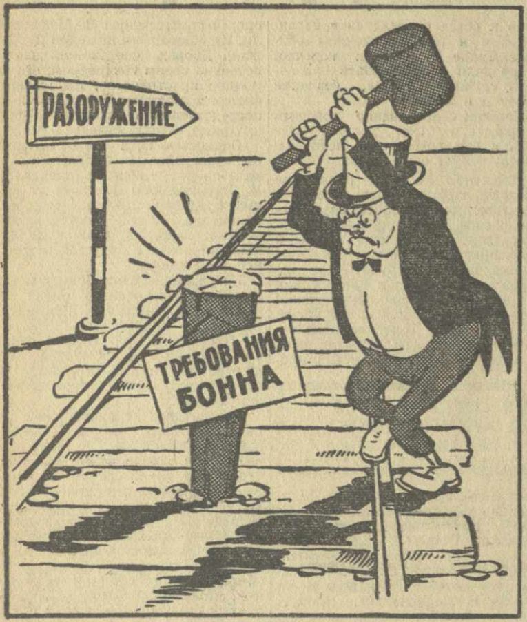
НА ПУТЯХ К РАЗОРУЖЕНИЮ. Рис. А. Канделаки