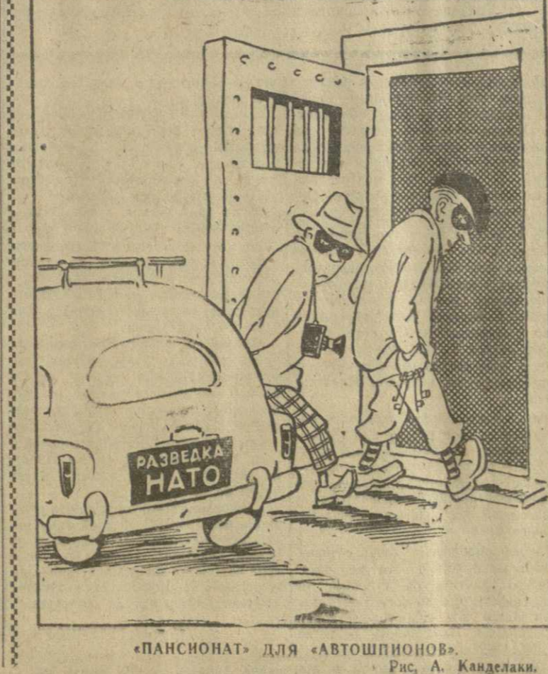
«ПАНСОНАТ» ДЛЯ «АВТОШПИОНОВ».