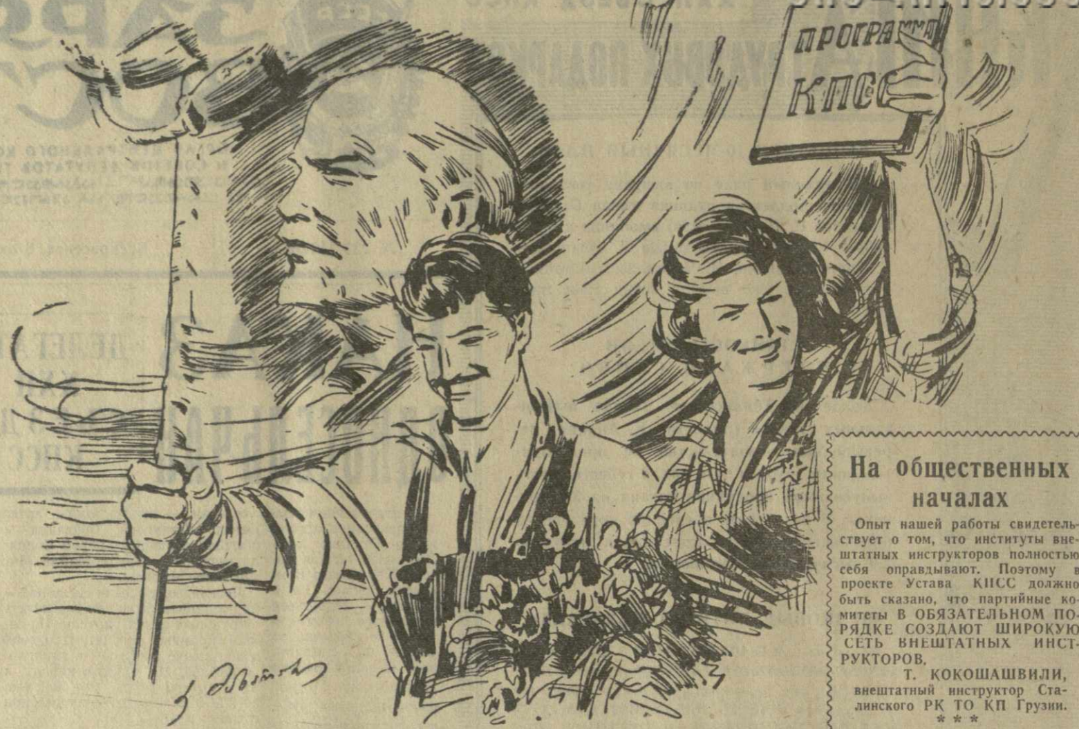
Рис. К. Махарадзе.

Именно поэтому, например, Батумский машиностроительный завод выпускающий около 50 видов машин для различных отраслей пищевой промышленности страны,