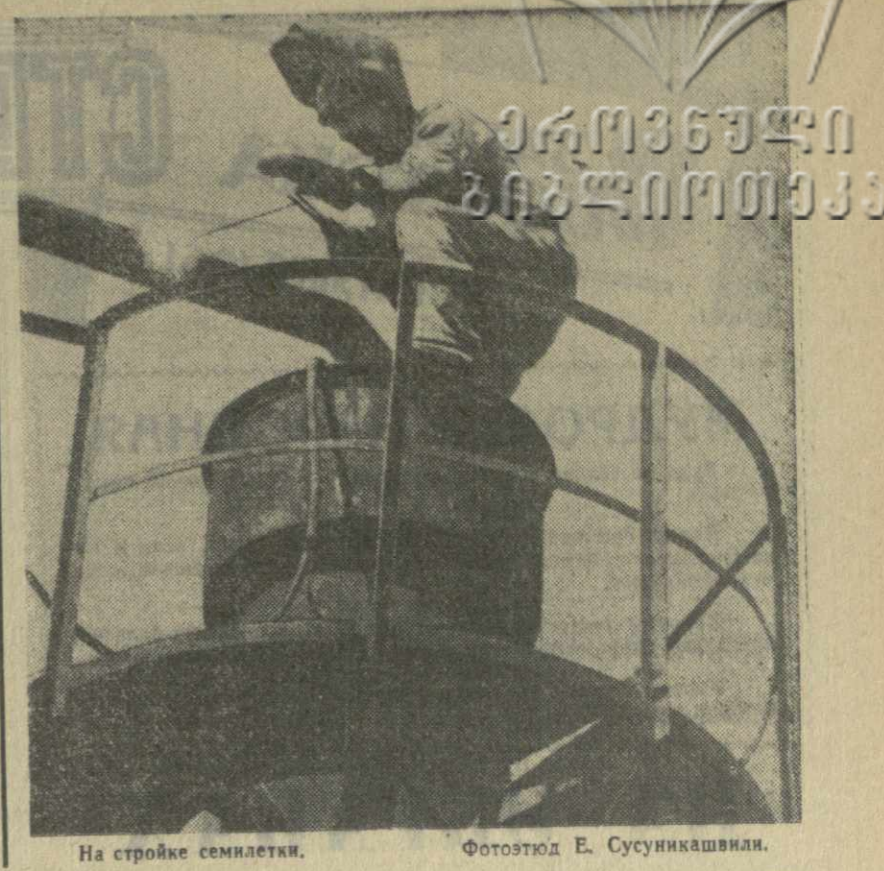
На стройке семилетки.

В заключение Насер заявил, что он прилагал все усилия к тому, чтобы служить своему народу в борьбе против империализма и сотрудничающих с ним реакционных элементов.