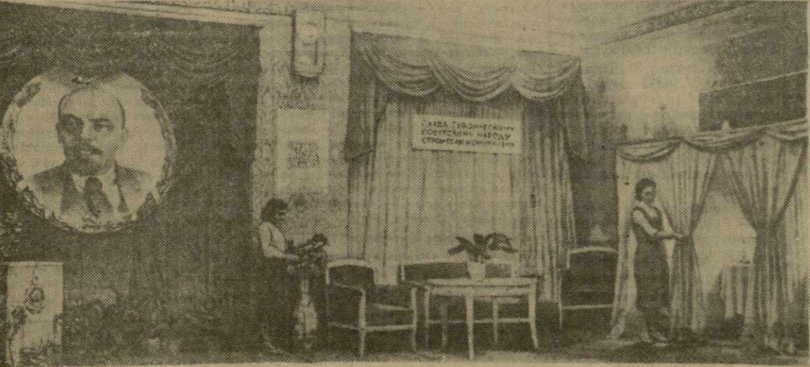
Избирательный участок № 9/58 по выборам в Верховный Совет СССР при Тбилисском доме культуры медработников имени И. Чавчавадзе готов к приему избирателей.

...Наступил долгожданный день. Гостеприимно распахнуты двери избирательных участков. Добро пожаловать, дорогие избиратели!