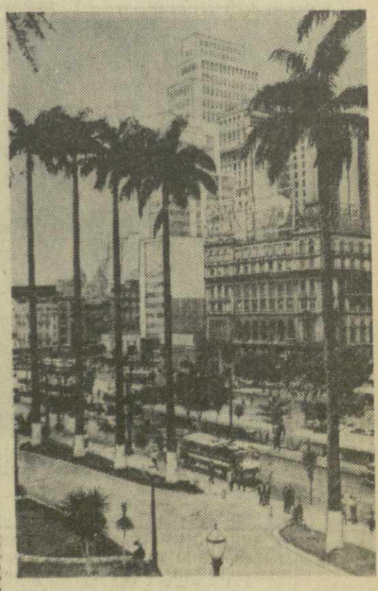
Бразилия. Сан-Паулу. Центральная часть города.

ли осуществление актов саботажа на промышленных предприятиях, убийство руководителей революционных организаций провинции и мирных граждан.