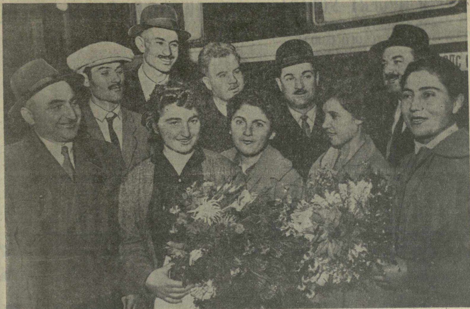
Вчера для участия в работе XXII съезда КПСС в Москву выехали делегаты съезда от нашей республики.

Корпус речного трамвая изготовлен из стеклопластика.