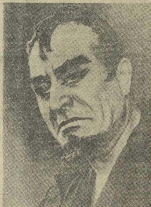
Ким Борг в роли Мефистофеля.

Тбилисские зрители будут рады второй встрече с популярным шведским певцом Кимом Боргом.