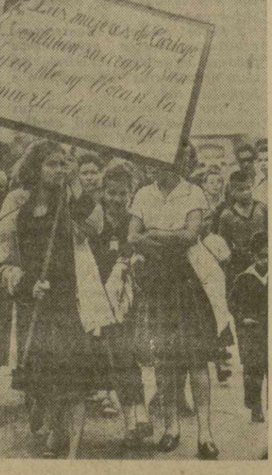
На снимке: группа демонстрантов с плакатом: «Женщинам Картаго оплакивают смерть своих символов».

В Коста-Рике все больше и больше снижается жизненный уровень населения. Недавно власти повысили цены на электроэнергию. В связи с этим в городе Картаго состоялась демонстрация протеста. На демонстрантов напали солдаты. В результате столкновения и имеются убитые в десятки раненых.