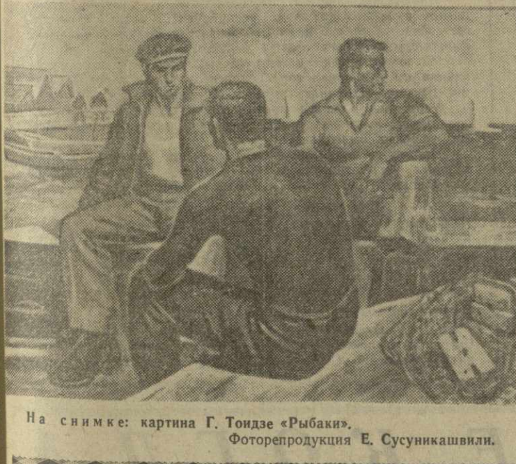
На снимке: картина Г. Тоидзе «Рыбаки».

В Союзе композиторов Грузии прошла очередная музыкальная пятница.