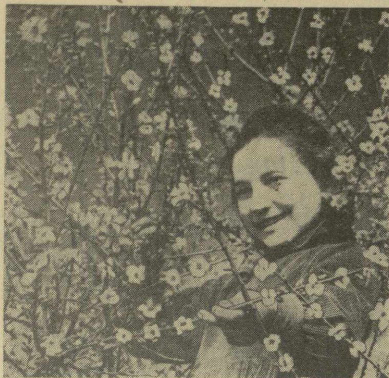
МИНДАЛЬ ЦВЕТЕИ