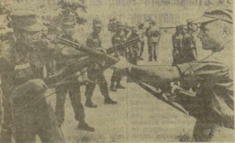
Юный Вьетнам. На снимке — американский капитан Маккензи (справа) обучает южновьетнамских солдат приемам рукопашного боя.

ЗАПАДНЫЙ БЕРЛИН, 18 февраля. Корреспондент ТАСС М. Пашиня передает: Здесь опубликованы официальные предварительные результаты состоявшихся 17 февраля выборов в западноберлинское городское собрание депутатов. СДПГ получила на выборах 61,9 проц. голосов; ХДС — 28,9 проц. голосов; СВДП — 7,9 проц.; СЕПГ Западного Берлина — 1,3 проц. голосов избирателей. В соответствии с этими результатами СДПГ получила в городском собрании депутатов Западного Берлина 89 депутатских мест, ХДС — 41, СВДП — 10 мест. СЕПГ Западного Берлина собрала 20.887 голосов избирателей. Несмотря на это, она не получила ни одного мандата в городское собрание депутатов в результате применения на выборах антидемократического избирательного закона. Таким образом, выборы принесли наибольшее поражение западноберлинским приверженцам партии Аденауэра — ХДС. Это убедительно свидетельствует о росте недовольства среди западноберлинского населения неприкрытым противодействием этой партии германскому мирному урегулированию и нормализации положения в Западном Берлине.