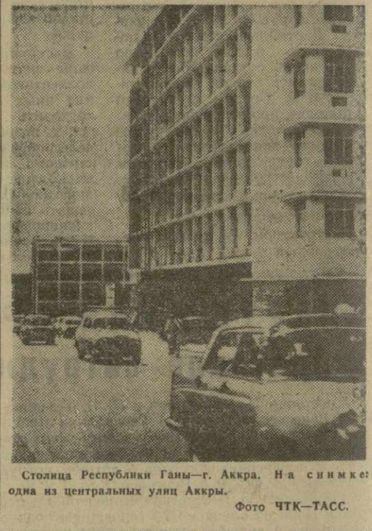
Столица Республики Гамбия — г. Аккра. На снимке — одна из центральных улиц Аккры.

Все это является по-высокому показателем того, что дальнейшее обострение противоречий в лагере империализма неизбежно.