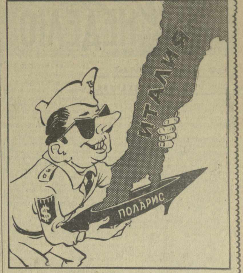
ПРИМЕРКА АМЕРИКАНСКОЙ «ЛОДОЧКИ» Рис. А. Канделакис.

члене престарелых, но под яростным натиском бизнесменов от медицины сенат провалил этот законопроект. Богатейшая страна, бросающая многие миллиарды долларов на вооружение, оттолкнула протянутую руку своих престарелых и больных граждан. И как не вспомнить здесь строки из великого документа эпохи — Программы КПСС: «Социалистическое государство — единственное государство, которое берет на себя заботу об охране и постоянном улучшении здоровья всего населения. Это обеспечивается системой социально-экономических и медицинских мероприятий». С каждым годом наше государство отпускает все больше и больше средств на улучшение медицинского обслуживания населения. Только в нынешнем году в нашей республике будет израсходовано на эти цели 91,396 тысяч рублей, что на 5,2 процента превышает сумму, предусмотренную бюджетом 1962 года. На капитальное строительство курортов республиканского значения отпущено 4,023 тысячи рублей. А это значит, что распахнутся двери новых «цехов здоровья», звонким ребячьим смехом наполнятся светлые и уютные детские сады и ясли, в чудесных здравницах, расположенных на побережье Черного моря и в живописных горах, отдохнут и поправят свое здоровье тысячи советских людей. Самое ценное на земле — человек. Вот почему таким великим смыслом наполнены для нас скучные строки сообщения ЦСУ. «В 1962 году продолжалось дальнейшее расширение сети лечебных учреждений и улучшение медицинского обслуживания населения».