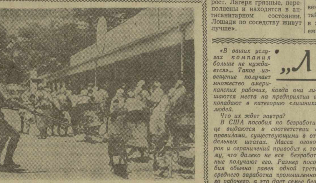
Белые расисты в Южной Родезии жестоко расправляются с теми, кто стремится покинуть с бесправным положением коренного населения этой страны. Лидер запрещенной в Южной Родезии партии — Союз Африканского народа Зимбабве Джошуа Нкомо, недавно освобожденный из тюрьмы, снова арестован властями. Он обвиняется в нарушении закона «о поддержании порядка». На снимке: полицейский разгоняет толпу женщин, собравшихся перед зданием суда в Рузале для того, чтобы выразить протест против расправы с Джошуа Нкомо. У полицейского на поясе наручники, на длинном поводке — зло рычавшая овчарка.