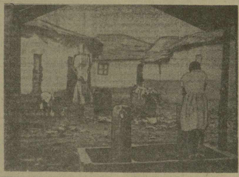
На снимке слева — трущобы, в которых живут африканцы в главном городе английской колонии Кения — Найроби; справа — Соединенные Штаты Америки. Палатка, в которой ютятся негритя и ская семья в штате Теннесси. Ее изгнали вместе с другими семьями из дома после того, как негры зарегистрировались в качестве избирателей.

ДВА ДЕМОКРАТИИ Американский нефтяной король Поль Гетти имеет личный капитал свыше 1 миллиарда долларов. Эта сумма равна годовому доходу 1 миллиона американских семей.