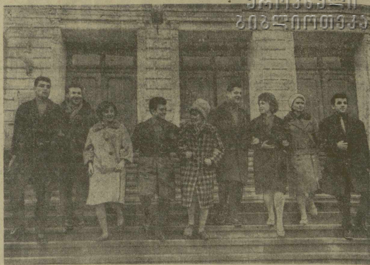
Тбилисский государственный университет — старейшее учебное заведение республики. Здесь учатся юности и девушки различных национальностей. Их связывает нерушимая братская дружба. Посмотри на этот снимок, читатель! На нем запечатлена группа студентов университета, приехавших в Тбилиси из разных городов и республик нашей необъятной страны. Они живут одной дружной семьей.

стие 139.957.809 человек, или 99,95 процента всех избирателей. Такой политической активности не знает ни одна капиталистическая страна. Ту же картину дают и выборы в Верховные Советы союзных республик. На предыдущих выборах в Верховный Совет Грузинской ССР было избрано 368 депутатов, из них рабочих — 64, колхозников — 99 и женщин — 106. В местные Советы последнего созыва были избраны 41.149 депутатов. Из них рабочих — 3.584, колхозников — 21.375. В числе избранных — 17.791 женщина. Эти цифры — наглядное свидетельство того, что широкие массы трудящихся принимают непосредственное участие в управлении нашим всенародным государством.